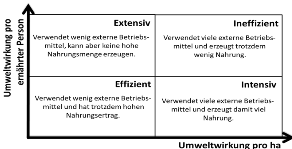
Abbildung 2: Einteilung von Betriebsklassen durch FarmLife innerhalb eines Produktionszweiges

Eines der wesentlichsten Ergebnisse aus dem Bewertungskonzept FarmLife ist deshalb die Zuordnung des Einzelbetriebes zu einer der vier, in Abbildung 2 beschriebenen Betriebsklassen. Diese Zuordnung wird erst durch die Erstellung von Ökobilanzen möglich, da nur diese alle Vorleistungswirkungen mit berücksichtigen können.