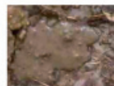
2 = flüssig