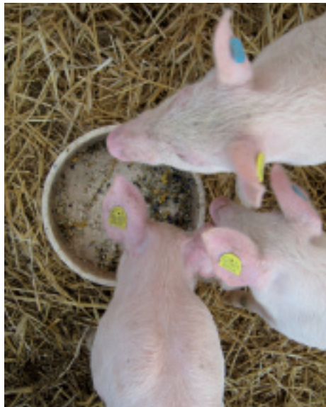
▲ Im Versuch wurde den Ferkeln die Kräutermischung über einen Zeitraum von einer Woche nach dem Absetzen angeboten.

In einem zweiten Versuch wurden anstelle der Kräuterextrakte natürliche Kräuter (Knoblauch, Kamille, Karotte, Heidelbeere, Maral und Löwenzahn) verwendet. Auch hier kamen Tonminerale (Bentonit) zum Einsatz. Anstatt der Milchsäurebakterien wurden Effektive Mikroorganismen (EM) eingesetzt. Im Unterschied zum ersten Versuch wur-