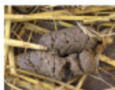
0 = fest

Die Ausscheidungen der Ferkel wurden an fünf Tagen auf ihre Konsistenz (fest, breiig, flüssig) beurteilt.