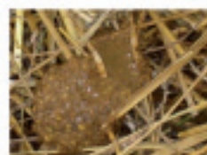
1 = breiig