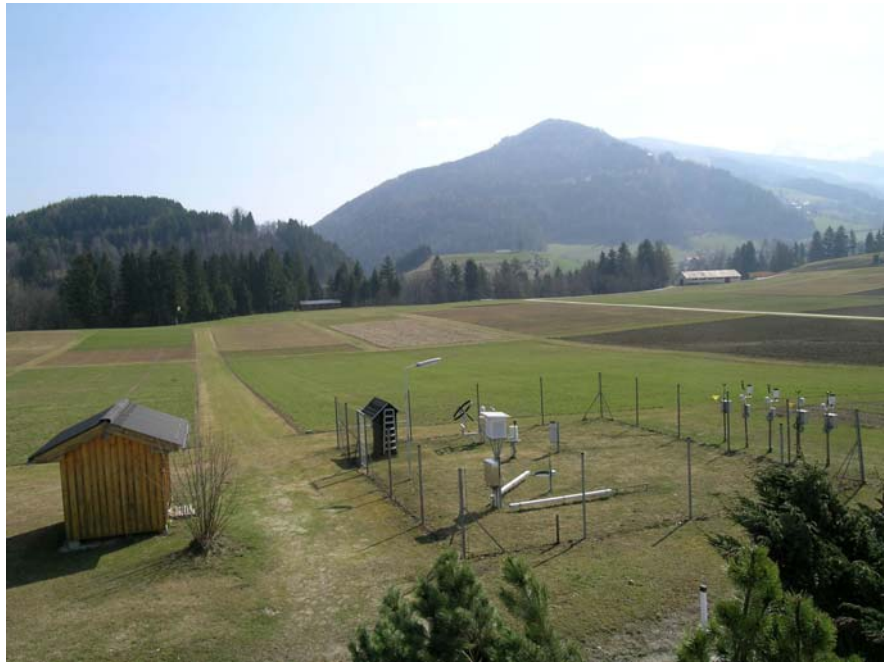
Abbildung 3: Neue Station in Gumpenstein