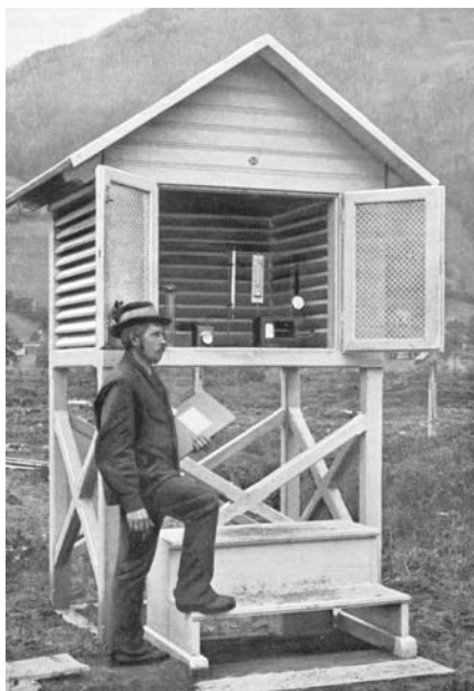
Abbildung 1: Klimahütte der Moorwirtschaft Admont

wie die Anschaffung von Maschinen und Geräten diskutiert und gegebenenfalls beschlossen.