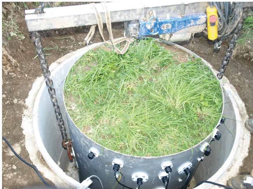
Abbildung 1: Lysimeter mit Sondenausstattung vor dem Einbau

Die Sensorausstattung der wägbaren Lysimeter ist auf die Tiefen 10, 30 und 50 cm konzentriert und umfasst TDR-Trime Sonden pico32 (IMKO GmbH) zur Wassergehaltmessung sowie mit Temperaturerfassung kombinierte Tensiometer T8-30 (UMS GmbH) zur Bestimmung des Matrixpotentials (siehe Abbildung 2 ). Die Sickerwassererfassung erfolgt über einen 50 Liter-Tank und eine Waage, die grammgenau den Sickerwasseraustrag erfassen kann. Der Einsatz einer bidirektionalen Pumpe sowie eines Saugkerzenrechs an der Unterseite des Lysimeters und Tensiometer im Freiland in gleicher Tiefe, ermöglichen feldidentische Wasserflüsse an der Unterkante der Bodensäule (von Unold, 2008).