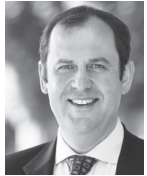
Bundesminister für Land- und Forstwirtschaft, Umwelt und Wasserwirtschaft Josef Pröll

Ein gesunder Boden mit intakten Funktionen ist ein wesentlicher Bestandteil einer nachhaltigen Landwirtschaft, sowohl was die Nahrungs- und Lebensmittelproduktion als auch die Erzeugung von Rohstoffen betrifft. Teil einer Strategie für einen vorsorgenden Umgang mit dieser wertvollen und nicht erneuerbaren Ressource muss auch der sachgerechte Umgang mit Düngemitteln sein – sei es in mineralischer Form oder als Wirtschaftsdünger.