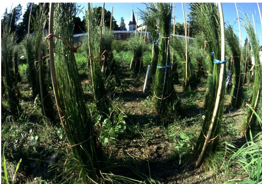
Abbildung 1: Futterpflanzenzüchtung an der HBLFA Raumberg-Gumpenstein

„Guru“, eine Sorte von Englisch Raygras ist hingegen speziell auf Winterhärte gezüchtet. Zwei Sorten von Fuchsschwanz sind inzwischen in die EU-Sortenliste eingetragen, deren herausragende Eigenschaft in ihrer Spätreife liegt, womit sie nicht wie die anderen, deutlich frühere Sorten dem restlichen Grünlandbestand vorauswachsen. Beim Schnitt sind die Gumpensteiner Sorten im optimalen Qualitätsstadium