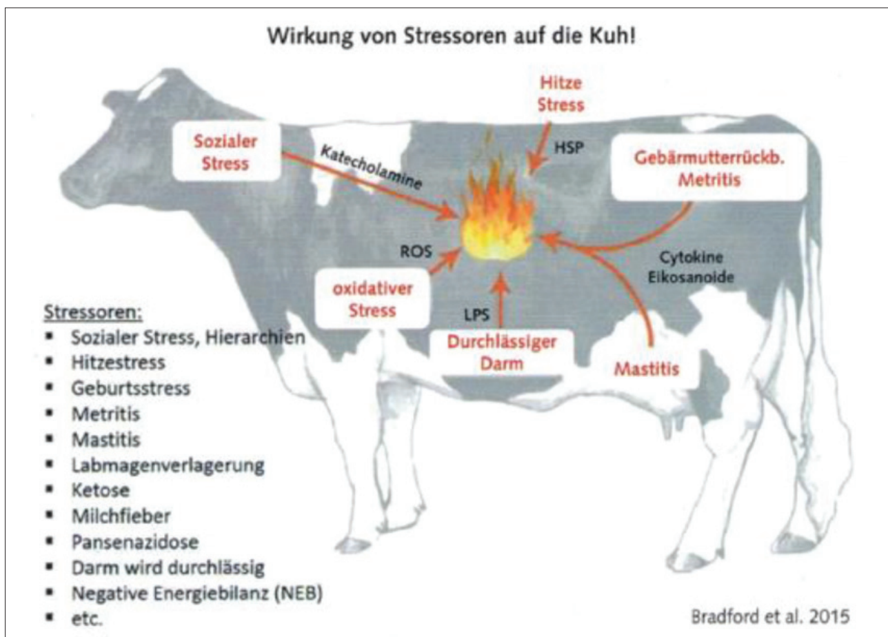
Abbildung 2: Auslöser von Systemischen Entzündungen bei der Milchkuh (BRADFORD 2015, ergänzt von KOCH und SCHEU 2016)

Wenn auch die Auslöser zwischen Mensch und Tier (Kuh, Sau, Geflügel) nicht uneingeschränkt übereinstimmen