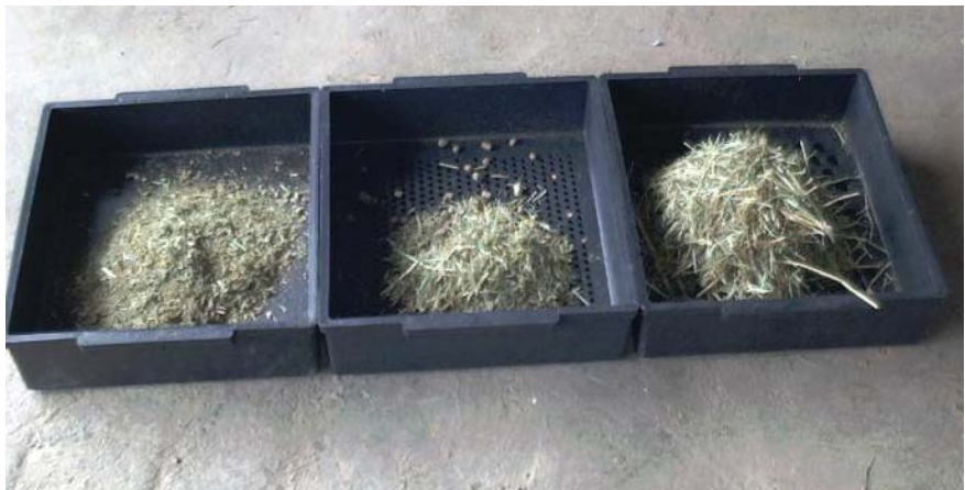
Abbildung 1: Penn State Particle Separator („Schüttelbox“) mit 2 Sieben und Wanne

Zur Frage der Strukturbewertung hat es in den letzten Jahren eine Reihe von Entwicklungen und Neuerungen gegeben. Bisherige Faustzahlen für die praktische Gestaltung einer wiederkäuergerechten Ration waren z.B. mindestens 400 g „strukturwirksame XF“/100 kg LM, ein „kritischer Strukturwert“ von mindestens 1 (STEINGASS und ZEBELI 2008), oder mindestens 40 - 45 % Halmfutter in der Gesamt-TM und 18 % XF in der TM, davon 2/3 mit \geq 3,7 cm Faserlänge (KAMPHUES et al. 2014). Die Erfüllung dieser Voraussetzungen war in der Praxis jedoch nur schwer umzusetzen (STEINGASS und ZEBELI 2008). Daher wurden diese Angaben aufgrund neuer wissenschaftlicher Erkenntnisse über das Zusammenspiel von Fütterung, Pansengesundheit und Leistung relativiert und darauf basierend neuere und präzisere Empfehlungen für die gesunde Rationsgestaltung der Hochleistungskuh abgeleitet (ZEBELI et al. 2008, GfE 2014).