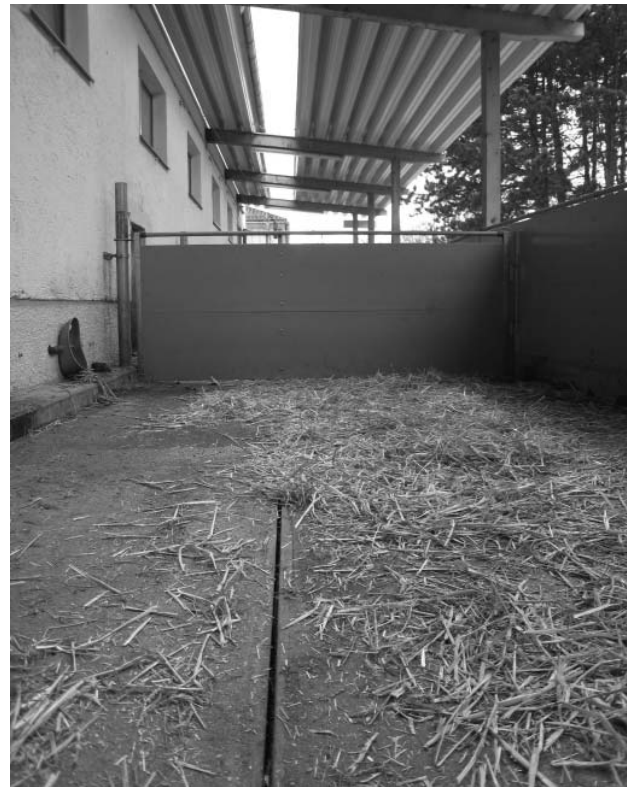
Foto 2: Im Biobereich darf der Auslauf nur teilweise überdacht sein. Eine Abflussrinne sichert trockene Laufflächen.

Im § 16 (2) ist geregelt, dass dem Tier ein Platz zur Verfügung gestellt wird, der seinen physiologischen und ethologischen Bedürfnissen angemessen ist.