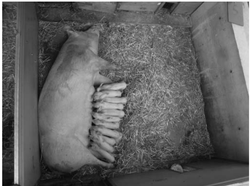
Foto 1: Schon in den ersten Lebenstagen wird ein attraktiver Auslauf von den Ferkeln genutzt.

Für Aufzuchtferkel und Masttiere gilt sinngemäß die oben erläuterte Einschätzung. Besondere Beachtung erfordert die Situation bei sehr jungen Tieren, v.a. bei Ferkeln bis zu einem Alter von 14 Tagen. Die temperaturmäßig angepasste Liegefläche für Saugferkel beträgt etwa 0,1 m 2 pro Tier und sollte mit einer externen Wärmequelle beheizbar sein (Deckel- oder Bodenheizung, Ferkellampe). Die Stallhülle wird in Bio-Abferkelställen häufig nicht oder nur gering beheizt. Ferkel werden dadurch schon sehr früh mit Temperaturen konfrontiert, die niedriger sind als in der Fachliteratur gefordert. Geburten bei tiefen Stalltemperaturen erfordern