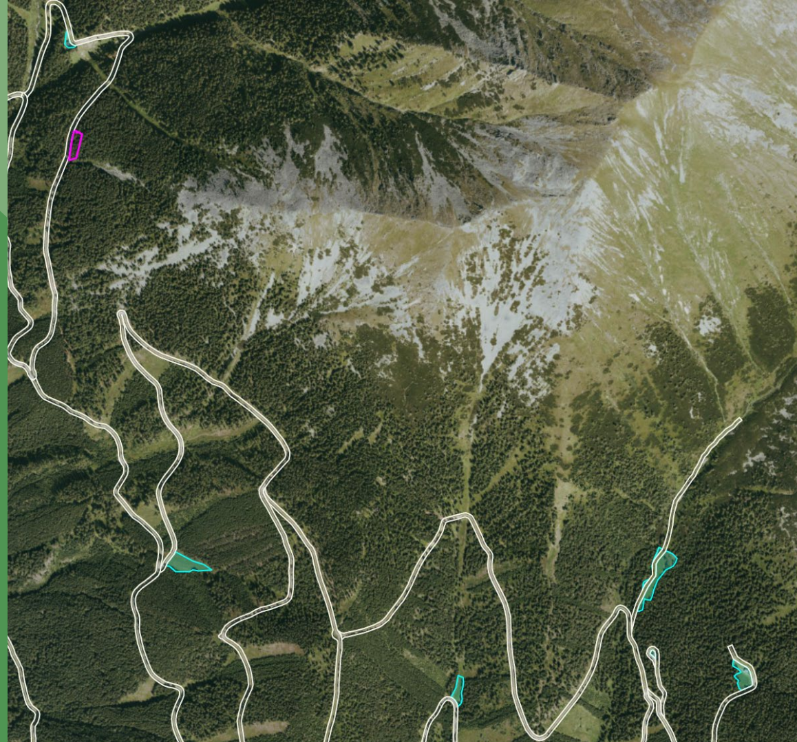
Rotwildfütterung im Rotwildkerngebiet