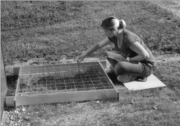
Abbildung 4: Abloten mit Frequenzrahmen.

Fläche des Rahmens, desto größer werden der Randanteil im Bezug auf die Aufnahme­fläche sowie die Häufigkeit unsicherer Entscheidungen (Müller-Dombois und Ellenberg, 1974). In der Grünlandforschung werden Quadraten von 0,5 x 0,5 m oder 1 x 1 m sehr häufig verwendet (Whalley und Hardy, 2000). Rahmen können für die Beurteilung des Deckungsgrades, der Pflanzendichte oder auch der Frequenz herangezogen werden.