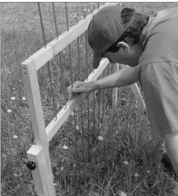
Abbildung 5: Abloten mittels Frequenzgestell.

Für Frequenzmessungen werden üblicherweise quadratische Rahmen in 100 Quadraten unterteilt. In jedem Quadrat wird das Vorkommen jeder einzelnen Art erhoben. Die Anzahl aller Quadrate, bei denen die Art vorkommt, ergibt ihre Frequenz. Runde Rahmen mit einer Fläche von 0,1 m 2 können nach Raunkiaer (1934) für eine zufällige Auswahl der Beobachtungsstellen verwendet werden, an denen das