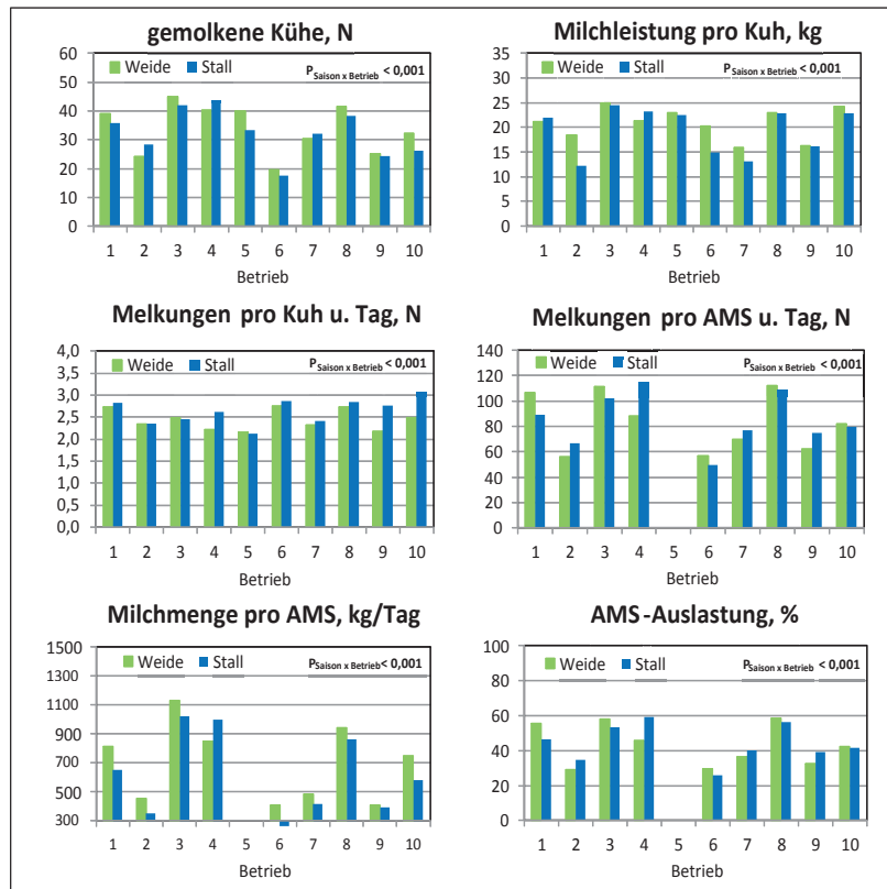
Abbildung 1: AMS-Ergebnisse der 10 Projektbetriebe

Es zeigte sich ein signifikanter Anstieg der Kuhanzahl pro Betrieb von 31 Kühen vor der AMS-Umstellung auf knapp 36 Stück nach der AMS-Umstellung. Die signifikante Wechselwirkung (AMS x Betrieb) weist darauf hin, dass dieser Effekt jedoch nicht bei allen Betrieben in gleicher Weise ausgeprägt war, wenngleich alle Betriebe nach der AMS Umstellung mehr Kühe hielten als davor. Nach der AMS-Umstellung variierte die Kuhanzahl pro Betrieb zwischen 17 und 60 Kühen, von den 10 Bio-Betrieben hatten 4 Betriebe weniger als 35 Kühe. Da die Bestandesausweitung vorwiegend durch die Nachbesetzung mit Erstlingskühen erfolgte, ging die Stichtags-Lebensleistung bei AMS Umstellung signifikant zurück. Der Anteil an Erstlingskühen stieg an und es verringerte sich der Anteil an Kühen mit mehr als 4 Laktationen numerisch. Auch bei diesen Merkmalen zeigten sich signifikante Wechselwirkungen.