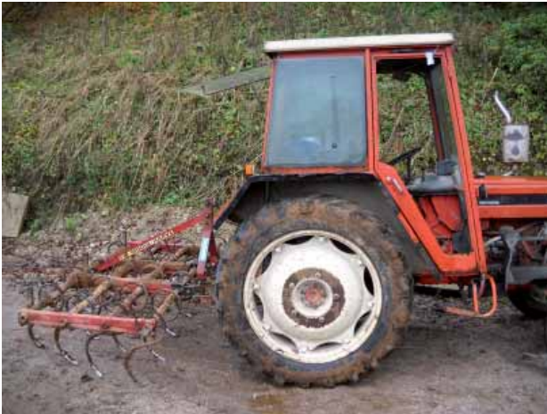
Abbildung 3: Grubber Traktor