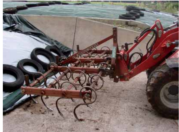
Abbildung 4: Grubber Hoftrac

Grundsätzlich sollten bei allen Stallbauplanungen, so auch beim Kompoststall, Nutzungsalternativen berücksichtigt werden.