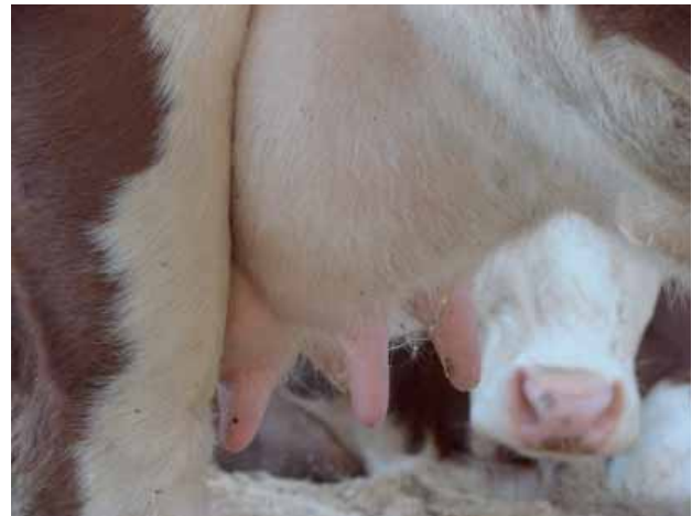
Abbildung 5: Saubere Tiere

Zu Beginn der Planphase für einen Stallbau empfiehlt es sich, ein Planungsteam aus Berater, Planer, den ausführenden Firmen (wenn schon bekannt), dem Betreuungstierarzt und weiterer Betreuungspersonen zu bilden.