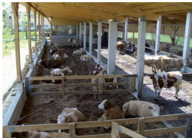
Abbildung 1: Kompoststall mit planbefestigtem Fressgang