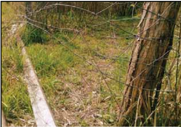
Kulturschutz-Zaun: kaum rehdicht zu halten!