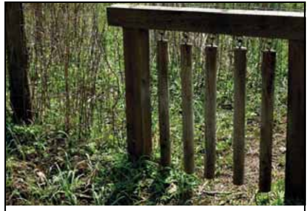
Notlösung: „Pendeltor“ für Kulturschutz-Zaun