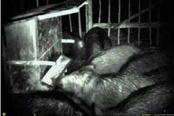
Bellebres Ziel: Rehwildfütterungen