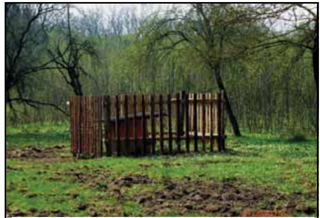
Rehwildfütterung – schwarzwildsicher