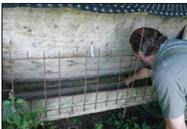
A lternative: Baustahlgitter an der Fütterung