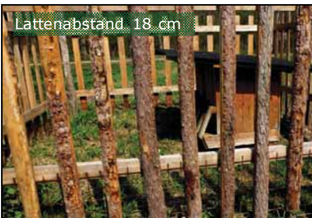
Lattenabstand 18 cm