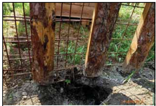
..... sonst hält es die Sauen nicht ab!