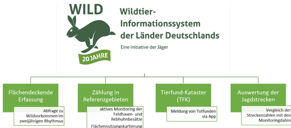
Abbildung 1: Säulen des Wildtier-Informationssystems der Länder Deutschlands (WILD)

In den einzelnen Bundesländern fungieren die WILD-Länderbetreuer der Landesjagdverbände als Ansprechpartner und Berater für die Jägerschaft vor Ort. Sie organisieren die verschiedenen Monitoringmaßnahmen, Schulen die Jägerschaft, erfassen die Daten aus den einzelnen Revieren in der WILD-Datenbank und führen Abstimmungen mit dem DJV durch. Bundesweit existieren drei WILD-Zentren (DJV, Thünen-Institut für Waldökosysteme, Institut für Natur- & Ressourcenschutz der Universität Kiel). Diese werten die Daten in Kooperation mit den Landesjagdverbänden aus und erarbeiten gemeinsam mit der Jägerschaft die zukünftigen Schwerpunkte des Monitorings. Über das freizugängliche WILD-Portal ( https://wild-monitoring.de/cadenza/pages/access/login_wild.xhtml ) sind einzelne Datensätzen in Form von Verbreitungskarten und Diagrammen abrufbar.