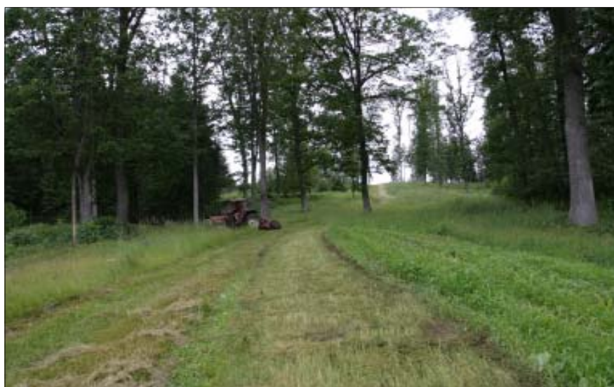
Wildwiesen werden auf 2-3 Etappen gemäht