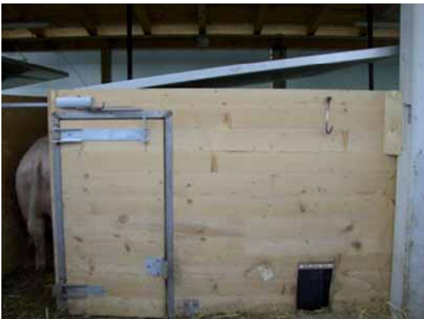
Abbildung 3: Liegekiste mit leicht geöffnetem Deckel und Auslauf für Ferkelschlupf