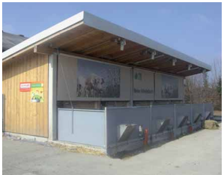
Abbildung 2: Außenansicht der Welser Abferkelbucht

Sitzen: Sitzen beim Schwein wird - wenn nicht im Zuge des Aufstehvorganges beobachtet - als Verhaltensstörung eingestuft oder als mögliche Beinschwäche (GRAUVOGL, 1984).