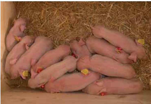
Abbildung 5: Ferkelnest innen mit Stroh eingestreut

Frosttiefe verlegt und als Ringleitung geführt. Die Tränke- nippel werden durch eine Begleitheizung frostfrei gehalten. Die im Auslauf angebrachte Futterraufe ist abgedeckt, um eine Durchnässung des Raufutters bei starkem Regen zu verhindern.