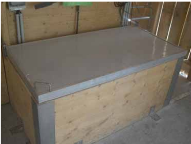
Abbildung 4: Ferkelnest mit beheizbarem Deckel