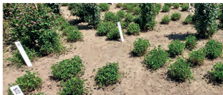
Züchtung einer klimaresistenten Rotkleeorte in Gumpenstein

In speziellen Fällen kann es sinnvoll sein, Grünlandbestände mit nur wenigen gewünschten Arten gezielt nachzusäen, beispielsweise mit Knaulgras und/oder Rotklee. Dann empfiehlt es sich, einfach die Einzelkomponenten zu kaufen und selbst zu mischen. Dabei aber unbedingt auf die Verwendung geprüfter Sorten achten! Das Frühjahr eignet sich sehr gut zur Grünland-Nachsaat, am besten mittels Übersaatstriegel. Dabei ist zu beachten, dass zu frühe Aussaatstermine vermieden werden sollen (Spätfrostgefahr), andererseits der Altbestand im Frühjahr sehr konkurrenzstark ist. Eine zusätzliche Düngung sollte daher eher vermieden und der erste Schnitt möglichst früh gesetzt werden, damit die nachgesäten Jungpflanzen schnell wieder ausreichend Licht bekommen. Eine Spätsommer-Nachsaat (ca. drittes Augustdrittel) funktioniert im Regelfall sehr gut und ist sowohl zur Sanierung von