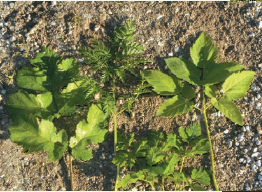
Wiesen-Bärenklau (links), Wiesen-Kerbel (2.v. links), Kälberkropf (2. v. rechts) und Geißfuß (rechts)