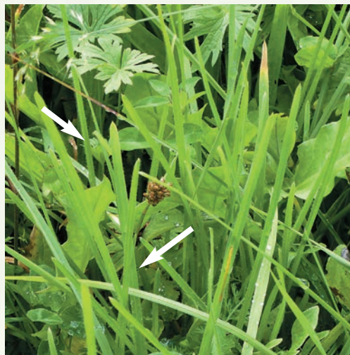
Markant für den Flaumhafer sind die langen Härschen an den Blatträndern.

Die häufigsten und am weitesten verbreiteten Unternutzungszeiger im Wirtschaftsgrünland sind vor allem verschiedene Distel- und Klappertopf-Arten, diverse Sträucher und verholzte Zwergsträucher, stachelige bzw. dornige Arten wie beispielsweise Dorn-Hauhechel oder der giftige Adlerfarn. Unternutzungszeiger sind im Allgemeinen ziemlich schnitt- und trittempfindlich. Sie kommen daher in erster Linie auf unternutzten oder zu spät genutzten Standweiden sowie Umtriebsweiden mit zu geringer Besatzdichte vor. Da die Klappertopf-Arten einjährig sind und deshalb regelmäßig aussamen müssen, finden sie in lückigen, spät gemähten Dauerwiesen oder unternutzten Dauerweiden günstige Lebensbedingungen vor. Unternutzungszeiger können durch stärkere Düngung in Kombination mit einer intensiveren Nutzung – vor allem mittels früherer und häufigerer Mahnungen – zurückgedrängt werden.