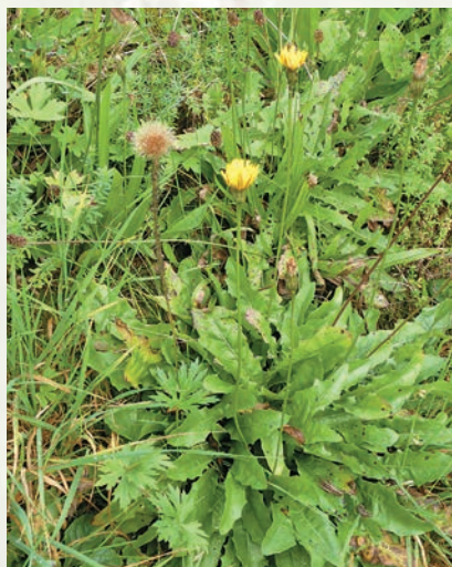
Der Rauer Löwenzahn hat im Vergleich zum Wiesen-Löwenzahn keinen weißen Milchsaft