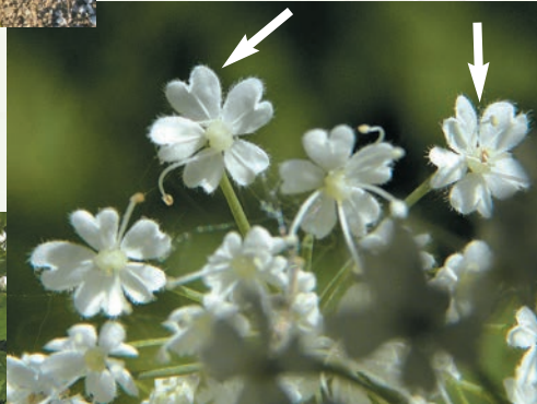
Beim Kälberkropf sind die Blüten- kronblätter mit feinen Härchen versehen.