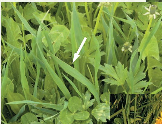
Die gedrehten Blätter sind typisch für die Acker-Quecke.