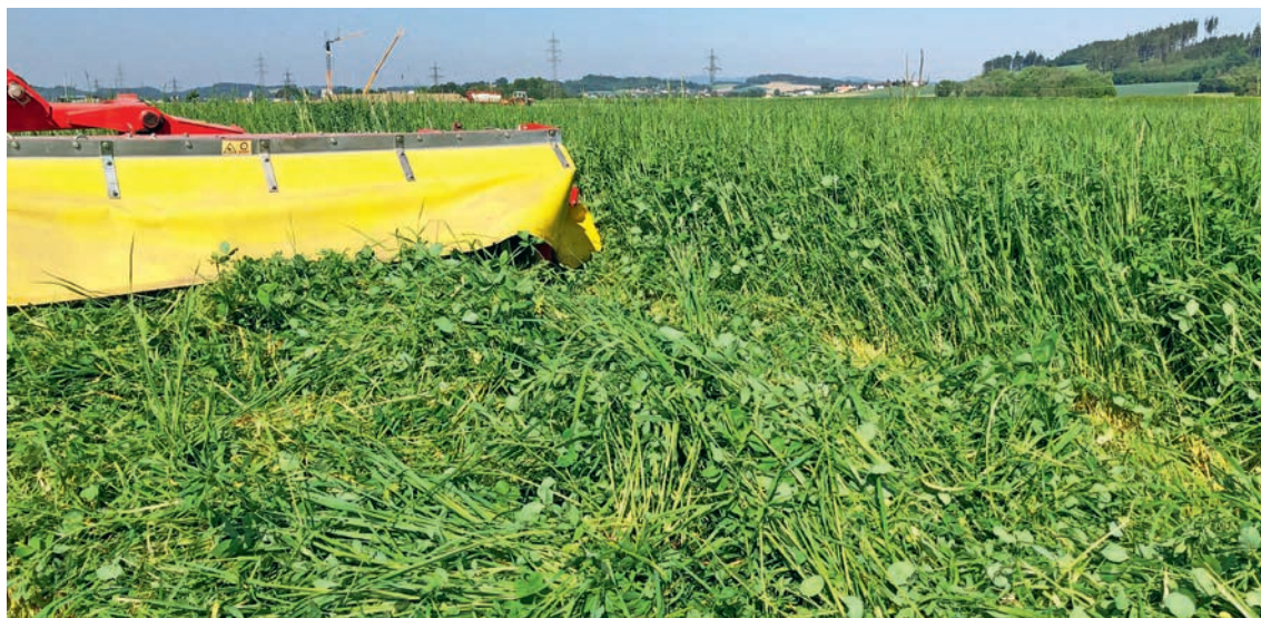
Abbildung 8: Mehrere Schnitte pro Jahr sind die beste Strategie unerwünschte Ackerunkräuter zu verdrängen.