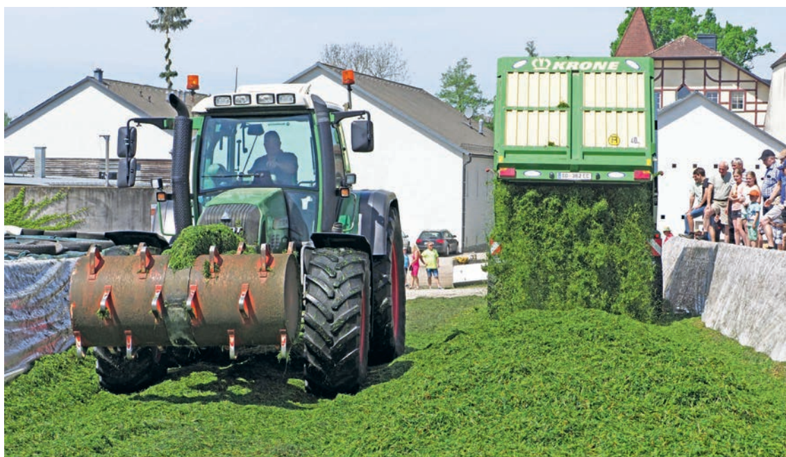
Abbildung 17: Eine ausreichende Verdichtung unter- stützt eine gute und schnelle Gärung.

Aktuelle Informationen zu Siliermitteln: ÖAG ( gruenland-viehwirtschaft.at ) und DLG ( siliermittel.dlg.org )