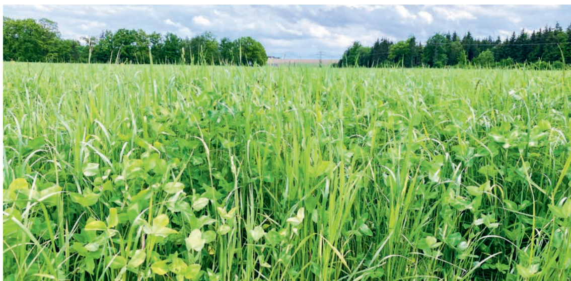
Abbildung 11: Gräser sind sowohl aus pflanzenbaulicher als auch aus Sicht der Tierernährung wertvolle Partner im Bestand.

ren 10 cm ansammeln. Klee- bzw. Luzernegras steht zumeist nur wenige Jahre am Feld und Rotklee und Luzerne zeigen einen hohen Wuchs. Daher werden als Graspartner hauptsächlich schnell- und hochwachsende Arten verwendet. Hier sind es in erster Linie horstbildende Ober- und Mittelgräser, wie das Knaulgras, das Wiesenlieschgras (Timothe), der Wiesenschwingel, der Glatthafer oder das Englische Raygras.