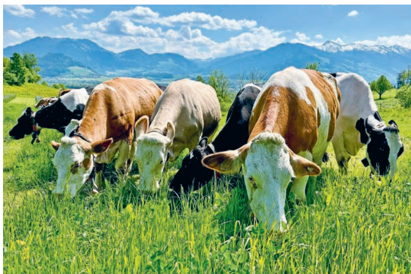
Abbildung 13–15: Je nach betrieblicher Strategie gehört ein gewisses Niedertrampeln des Bestandes bei „mob grazing“ dazu.

gebracht. Hier gilt es unter mitteleuropäischen Verhältnissen zu beachten, dass ein Humusaufbau im größeren Stil nur auf Ackerflächen und nicht auf bestehenden Dauergrünlandflächen möglich ist. Humusaufbau benötigt immer ein optimales Kohlenstoff- zu Stickstoff-Verhältnis und hier sind Pflanzenreste mit den tierischen Ausscheidungen die optimale Kombination.