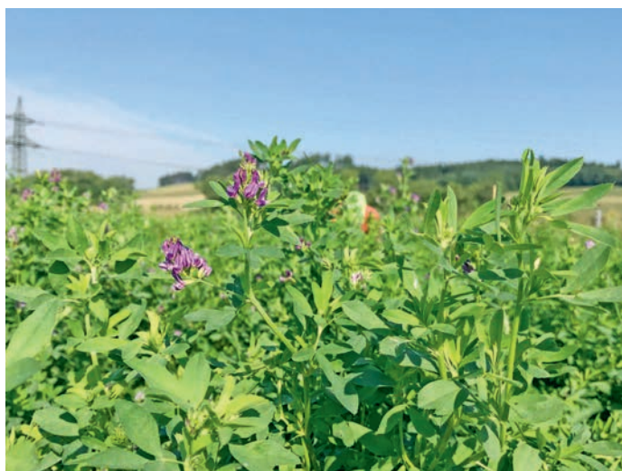
Abbildung 21–22: Rotklee und Luzerne sind beides ertragsstarke und wertvolle Futterleguminosen in Mitteleuropa.