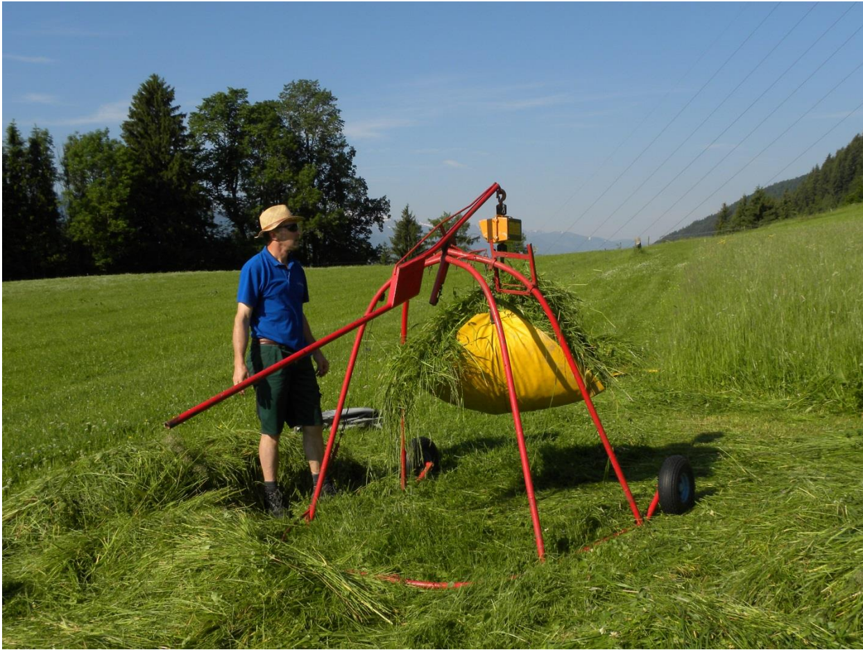
Tabelle 1: Überprüfte Versuchsvarianten