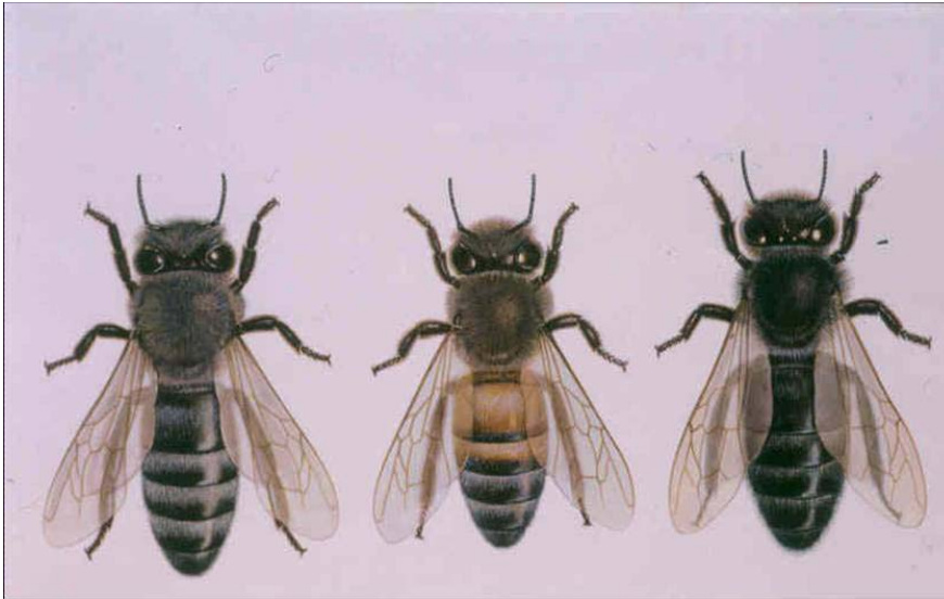
Abbildung 2: mellifera carnica (links), Apis mellifera ligustica (mitte), Apis mellifera mellifera (rechts); Aquarelle: M. MIZZARO

Im Übergangsbereich beider Rassen kam es natürlicherweise zu Kreuzungen, deren Produkte gewisse anatomische Merkmale beider Herkünfte zeigten und