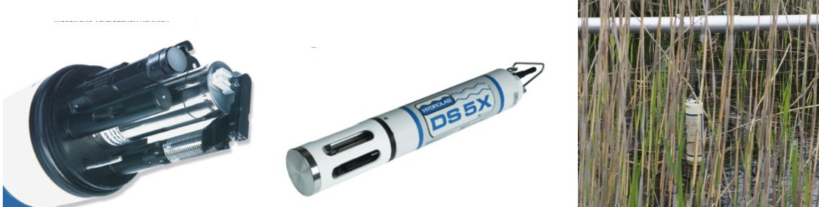
Bild: Multiparametersonde Hydrolab S5 mit Sensoren

Wasserqualitäts – Multiparametersonde Hydrolab S5