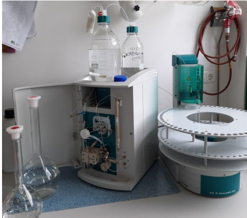
Bild: Ionenchromatograph IC