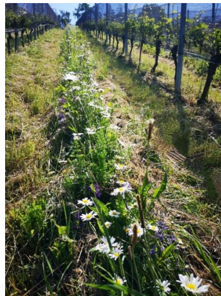
Weingarten mit Blühstreifen

Anschließend wurden die Fahrgassen mit dem Grünland-Sägerät mit geteiltem Säkasten eingesät, in den Fahrspuren wurde mit Rasengräsern (Wiesenrispe, Rotschwengel und Englischem Raygras) und im schmalen Mittelstreifen mit einer Mischung aus 31 Blühpflanzen, begrünt. Nachfolgend sind einige der gesäten Arten abgebildet.