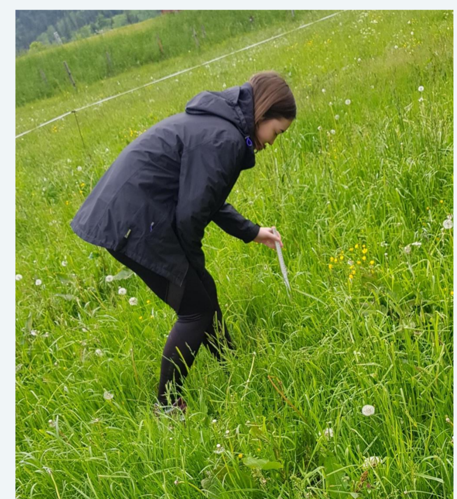
Abb. 2.: Aufwuchsmessung