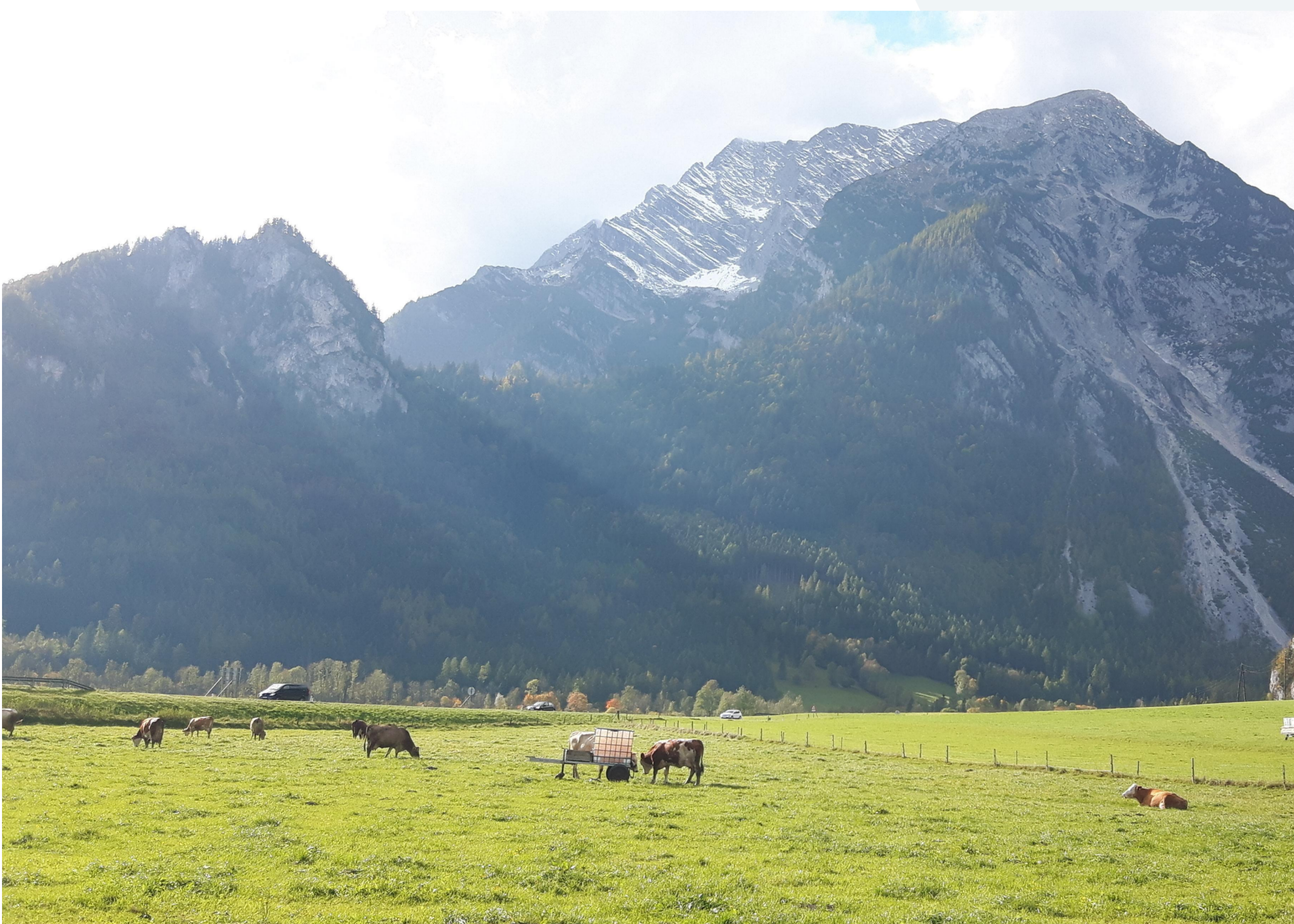
Abb. 1.: Versuchsweide Betrieb Schranz

Auf den Versuchsbetrieben wurden beim Austrieb auf die Weide im Frühjahr sowie beim Einstellen im Herbst jeweils sechs Kotproben im Versuchsintervall von sechs Wochen gezogen, sowie der Aufwuchs der Weide bestimmt. Der Kot wurde auf Farbe, Konsistenz und Verdauungsrückstände untersucht und die Ergebnisse dokumentiert. Für die Aufzeichnung der Milchleistungsdaten, sowie den Inhaltsstoffen wurden die Messergebnisse der LKV-Daten herangezogen.