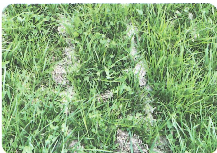
Mit dem Schleppschuh ausgebrachte Gülle muss verdünnt sein um eine Streifendüngung zu verhindern.

Kein Gras wächst ohne Futter, also muss auch die Versorgung mittels Wirtschaftsdünger sichergestellt werden. Diese ernähren nicht nur die Pflanzen, sondern sind die vorrangige Nahrungsquelle der Bodenlebewesen. Gerade bei der Weide ist eine frühzeitige Düngung mit flüssigen Wirtschaftsdüngern ganz entscheidend. Da der Weideaustrieb sehr früh beginnt sollte spätestens eine Woche davor die Gülle ausgebracht sein. Damit dies funktioniert muss die Gülle gut mit Wasser verdünnt sein. Für die Weide mixt man die Gülle zuvor nicht auf und saugt aus den mittleren Schichten der Grube an. So kommt eine relativ homogene und flüssige Gülle, ohne viel Strohanteile, auf die Weidefläche. Dabei sind Güllemengen von um die 15 m 3 /ha ausreichend. Im Österreichischen Berggebiet haben sich emis-