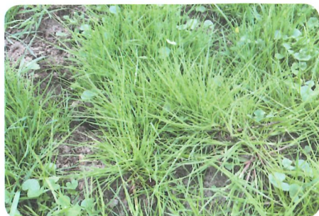
Die Gemeine Rispe vermittelt einen vermeintlich dichten Grasbestand.

Dieser Winter brachte in vielen Regionen eine teilweise mächtige Schneedecke. Der stellenweise lange liegen gebliebene Schnee fiel zu Beginn des Jahres auf einen vielerorts nicht gefrorenen Boden. Unter diesen Bedingungen kann sich an der Bodenoberfläche ein kühles Kleinklima von knapp über 0 °C ausbilden, was eine optimale Bedingung für den Schneeschimmel darstellt. Bei Flächen mit höheren Anteilen an Englischem Raygras muss daher besonders genaues Augenmerk auf etwaige Auswinterungsschäden gelegt werden. Dieses ist gegenüber Schneeschimmel sehr empfindlich. Der nicht gefrorene Boden unter einer Schneedecke ist aber auch optimal für Wühlmäuse und den Maulwurf. Daher kann bei Vorhandensein dieser Tiere auch von einer starken Schädigung der Grasnarbe ausgegangen werden. Sehr gerne legen Wühlmäuse ihre Gänge in den Filz der Gemeinen Rispe an, da diese nur oberflächlich leicht verwurzelt und der Rasenfilz nicht so ro-