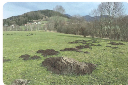
Bei Maulwurshügeln im Frühling ist die Wiesenegge notwendig.

Zum Schluss noch ein Blick auf das beliebte abschleppen des Grünlandes mit der Wiesenegge. Diese Maßnahme ist dann notwendig, wenn Mist vom Herbst oder nach der Frühjahrsdüngung besser verteilt werden muss. Der zweite wichtige Einsatzort für die Wiesenegge ist das glattstreichen von Erdhügeln der Maulwürfe und die Gänge der Wühlmäuse. Hier erfüllt die Wiesenegge ihre wichtige Aufgabe. Der Mythos der Anregung der Bestockung durch den mechanischen Reiz hält sich hartnäckig in den Köpfen. Nicht der mechanische Reiz löst die Bestockung beim Gras aus sondern die Intensität der Nutzung und die damit einhergehende raschere Blattneubildung.