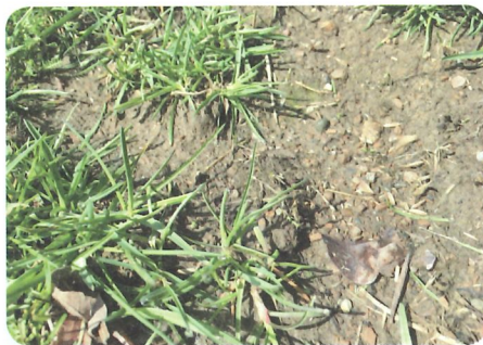
Lücken müssen über Nachsaaten geschlossen werden.

bust ist. Werden in weiterer Folge keine bestandesschließenden Maßnahmen getroffen, kann in den kahlen Stellen wieder die unerwünschte Gemeine Rispe eingewachsen. Damit täuscht sie auf vielen Flächen eine dichte Grasnarbe vor, weshalb eine genaue Beobachtung wichtig ist. Aus diesen Gründen ist es ganz entscheidend Bestandeslücken zu bewerten und bei offenen Stellen von deutlich über 20 Flächenprozent muss bereits im Frühling mit Nachsaaten reagiert werden. Lücken werden sonst immer nur von wenig wertvollen Arten schnell zugewachsen. Neben der Gemeinen Rispe können das unterschiedlichste Krautarten sein, die sich je nach Standort im Samenvorrat des Bodens befinden und die Chance zum Keimen nutzen. 20 % Lücken bedeuten, dass 1/5 der Fläche kein Futter bereitstellen. In anderen Worten ausgedrückt bedeutet dies, dass von 5 ha Pachtfläche für 1 ha unnötig Pacht gezahlt wird, da auf diesem keine Futterpflanzen wachsen. Dieser Vergleich sollte vor Augen führen, welches Potential generell im Grünland liegend und welche Auswirkungen immer größer werdende Kahlstellen in der Grasnarbe haben.