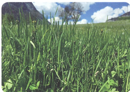
Dichte Grasbestände sind das Ziel im Dauergrünland.

Auf Wiesen entstehen durch das intensive Verbeißen und trampeln auf jeden Fall Lücken, die für eine oberflächliche Nachsaat optimal geeignet sind. Gerade das Problemgras Gemeine Risppe wird im Frühling von den Weidetieren viel besser vertreten und ausgerupft als von jedem Striegel. Wird diese Methode der Nachsaat in Kombination mit einer intensiven Frühjahrsbeweidung über mehrere Jahre durchgeführt, kann so ein guter Schnittwiesenbestand aufgebaut werden. Welche Saatgutmischung verwendet wird, hängt von der Zielnutzung ab. Soll auf der Fläche vorrangig das Futter als Heu oder Grassilage genutzt werden, dann sind auch dementsprechende Mischungen nachzusähen. Steht die Weide im Vordergrund, dann wird die Wahl auf eine Weide-Mischung fallen.