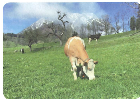
Nachsaat in Kombination mit Beweidung erzielt beste Resultate.

Bestandes bessere Bedingungen für die Keimlinge schaffen. Wichtig wie der Nachsaat auf Wiesen im Frühling ist, dass Maschinen verwendet werden, die die Grasnarbe stark aufreißen, offenen Boden hinterlassen, das Saatgut auf den Boden aufstreuen und nachlaufende Profilwalzen dieses gut an den Boden anpressen. Bei diesem Arbeitsgang können auch gleich Schäden durch wühlende Bodentiere ausgeglichen werden. Damit der Striegel aber richtig arbeiten kann ist ein halbwegs trockener Boden Voraussetzung. Dies wird in diesem Frühling auf vielen Flächen sicher eine Herausforderung sein.