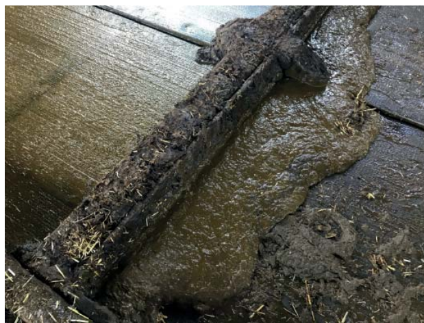
Abbildung 1: Kotverteilung auf 100% des Laufganges.

Die durch die Laufstallhaltung massive Ausweitung der emittierenden Oberflächen führt eben zu dem bereits zitierten Emissionsverhalten. Dabei fallen dem Verfasser bei