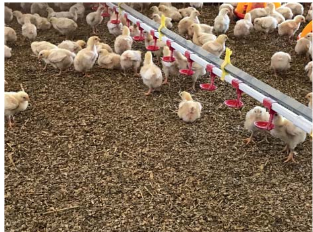
Abbildung 5: Eine saugfähige Einstreu und Tränken mit Auffangschalen fördern die Trockenheit.

Verwendung eines belüfteten Kotbandes in der Legehennen - Kleingruppenhaltung mit einem Bandabtrieb von einer Woche und im Vergleich zur Bodenhaltung ein Minderungspotenzial von sage und schreibe 87% (Eurich-Menden et al. 2010).