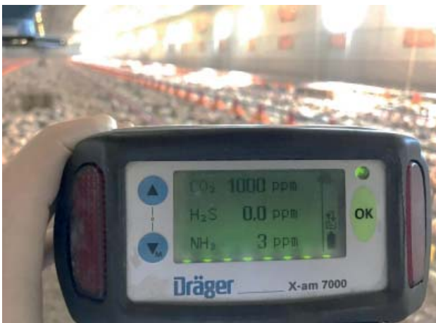
Abbildung 4: Stark reduzierte Ammoniakemissionen in modernen Masteinheiten.

Auch im Geflügelbereich kommt man am Fütterungssektor nicht vorbei. Eine an das Gewicht der Tiere angepasste Mehrphasenfütterung birgt ein Minderungspotenzial von immerhin 20%. Unvergleichbar höher ist ein verbessertes Management im Bereich der Entmistung. Eine schnelle Abtrocknung des Geflügelkots hat bei