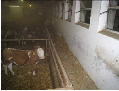
Abb. 1: Kaltluftsee in der Wintersituation