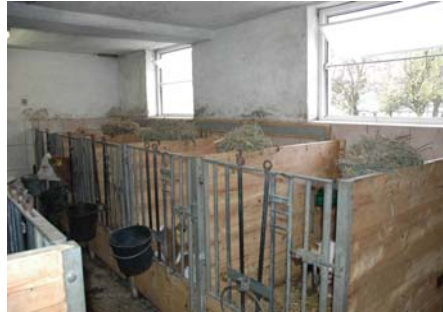
Abb. 2: Kalt- und Zugluft durch Fensterlüftung

Aus den bisherigen Untersuchungen geht hervor, dass bei Problembetrieben mit Kälberkrankheiten allein die Kosten für den Veterinär, verbunden mit hohem Medizinaleinsatz, um bis das Dreifache erhöht sind. Gleichzeitig zeigen aber auch dieselben Betriebe, dass mit nur wenigen Adaptierungen an der Luftführung im Stall eine sofortige Verbesserung herbeigeführt werden kann.