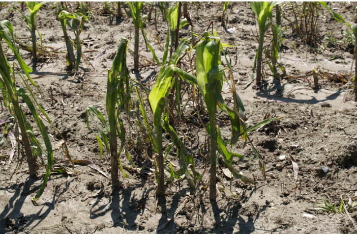
Maisfeld nach Hochwasser