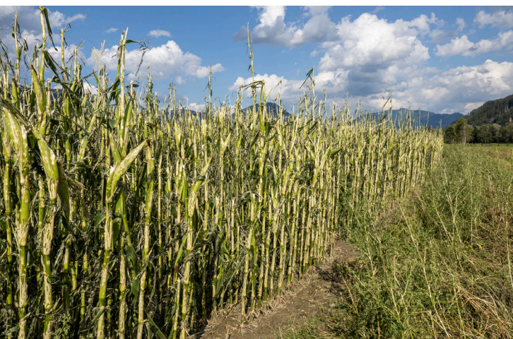
Maisfeld nach Hagelunwetter