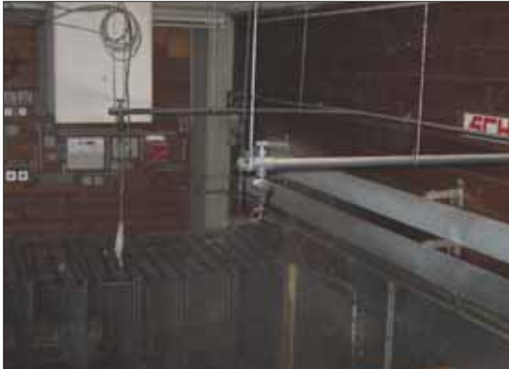
Luftkurzschlüsse am Abluftschacht sind vermeidbar.