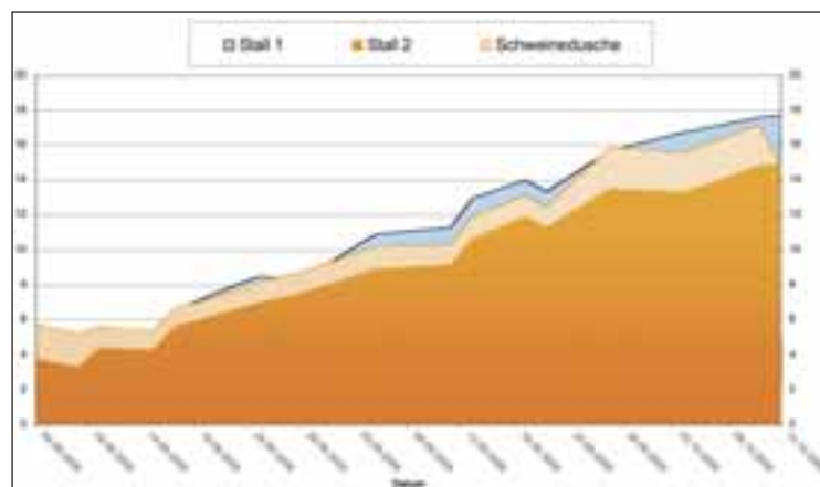
Grafik 2: Wasserverbrauch in m³/Durchgang.