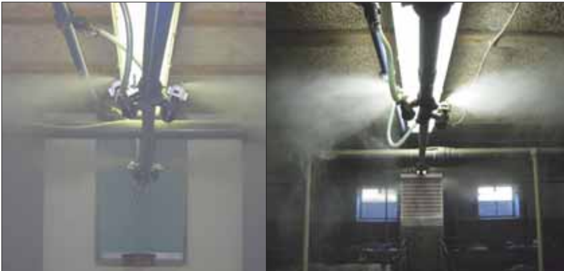
Schweineduschen fördern Wohlbefinden und Tierleitung

gisterspeicher wurde bereits als wirksam beschrieben. Je nach Dauer der Hitzeperioden und der Außentemperatur kann mit diesem System eine Reduktion von bis zu fünf Kelvin gemessen werden. Die Konditionierung oder Kühlung der Zuluft mittels Wasser ist sehr systembedingt und mit Vorsicht zu betrachten. Luftdurchlässige Materialien werden dabei mit Wasser berieselt und die durchströmende Luft erfährt einen Kühleffekt. Vorsicht bei Luftfeuchten ab 80 Prozent.