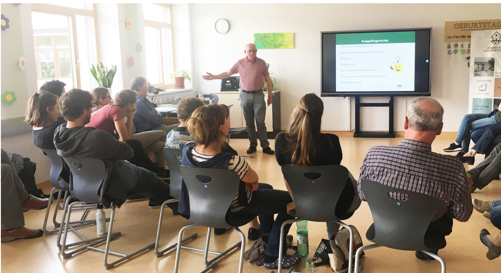
Foto: Perspektive Landwirtschaft - Veranstaltung in Hartberg (Stmk), Mai 2019

Zielgruppe: Bäuerinnen und Bauern auf der Suche nach einer Hofnachfolge oder Betriebskooperation, sowie künftige Bäuerinnen und Bauern auf der Suche nach einem Betrieb oder Hofgemeinschaft.