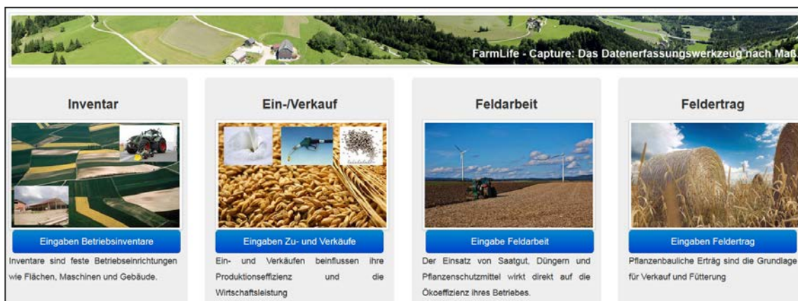
Abbildung 2: Screenshot aus dem Bereich Datenerfassung

Erträge/Erlöse eines landwirtschaftlichen Unternehmens können grundsätzlich in einer einfachen Einnahmen-/Ausgaben-Rechnung abgebildet werden. Daher ist die Dokumentation der Feldarbeiten wichtig! Für die Erhebungen sind somit folgende Arbeitsschritte zu erledigen: