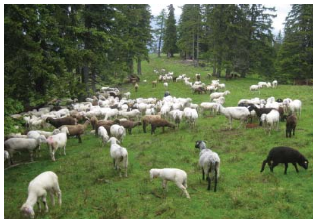
Abbildung 1: Nur gesundes Vieh auf die Alm

An und für sich gibt es bei der Tiergesundheit keine Diskussionen. Aber selbstverständlich darf nur gesundes und vorbereitetes Vieh auf die Almen aufgetrieben werden. Es kommt immer wieder vor, dass Tiere auf die Alm aufgetrieben werden, die keine Klauen geschnitten haben oder ohne Heimweide direkt vom Stall auf die Alm kommen. Eine Entwurmung vor der Weideperiode zu Hause im Stall sollte bei einem modernen Schafbauern kein Thema sein ( Abbildung 1 ).