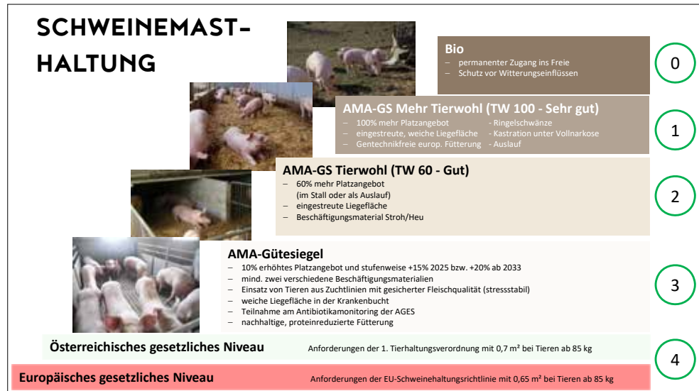
Abbildung 2: Übersicht Schweinehaltung in Österreich und EU