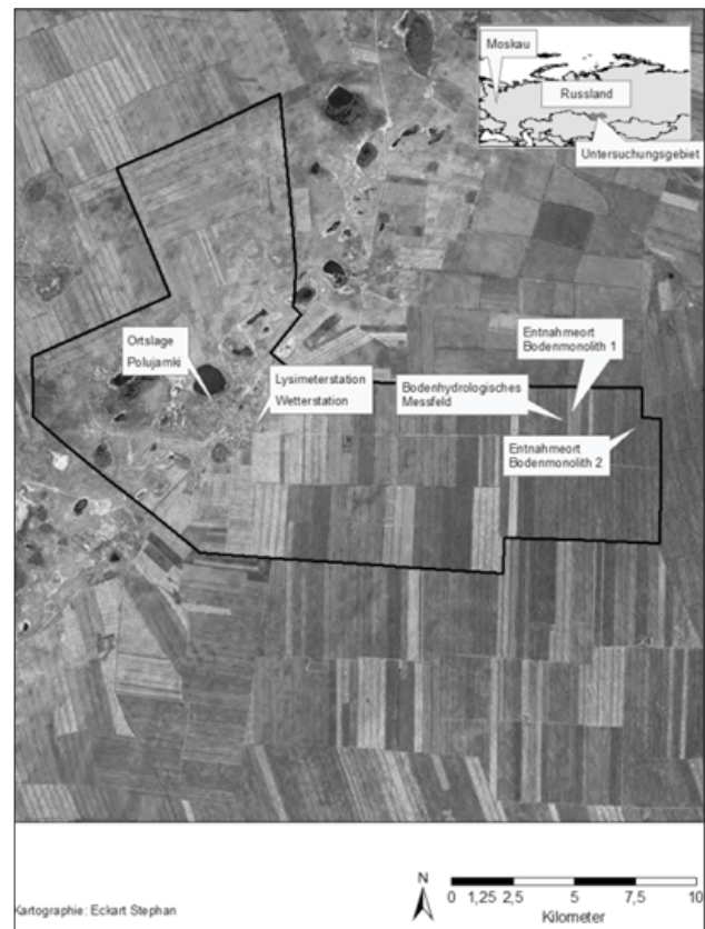
Abbildung 1: Lage des bodenhydrologisch-meteorologischen Messnetzes.

In der Ortschaft Polujamki wurden im Sommer 2013 ein bodenhydrologisch-meteorologisches Messnetz, bestehend aus einer Gravitations-Lysimeterstation, einem stationären bodenhydrologischen Messplatz und einer Wetterstation, installiert (Abbildung 1). Insbesondere das wägbare Gravitations-Lysimeter, das erste seiner Art im asiatischen Teil Russlands, ist geeignet, auch kleine Wasser- und Stoffflüsse zwischen Atmosphäre und Pedosphäre zu detektieren. In der Anlage werden zwei monolithisch extrahierte Bodensäulen in Hinblick auf ihre Oberflächennutzung und deren Einfluss auf den Bodenwasserhaushalt verglichen. So stammt Lysimeter 1 von einem langjährig ackerbaulich genutzten Standort, während Lysimeter 2 aus einem weitgehend unbeeinflussten Steppenboden entnommen wurde. Der Oberflächenbewuchs wurde bei der Entnahme beibehalten und auf Lysimeter 1 auch weiterhin die ackerbauliche Nutzung fortgeführt. Beide Monolithe weisen eine Oberfläche von je 1 m 2 und eine Tiefe von je 2 m auf. Jeder Monolith steht auf