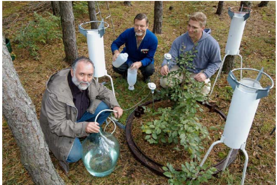
Abbildung 1: Einbau eines wägbaren Lysimeters in Eberswalde (Forstliche Versuchs- und Forschungsanstalt Baden-Württemberg (FVA))

In diversen Studien über Waldökosysteme sind Lysimeterversuche anzutreffen. Wie allerdings schon KRENN et al. (1999) feststellt, "gibt es jedoch eine große Anzahl unterschiedlichster Konstruk-