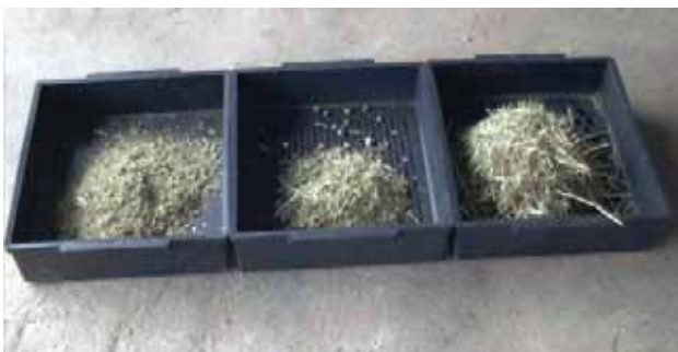
Abbildung 1: Penn State Particle Separator („Schüttelbox“) mit 2 Sieben und Wanne

Neben der Qualität der faserreichen Futtermittel, spielt vor allem die Faserlänge eine entscheidende Rolle. Eine zu geringe Partikellänge führt zur schlechteren Schichtung des Panseninhaltes und damit zu geringerer Wiederkauaktivität und Pansenmotorik, was zur Reduktion von ruminalem pH-Wert und Futteraufnahme, Faserabbau und Futtermittelverwertung führt (TAF AJ et al. 2007). Im Gegensatz dazu kann eine moderate Abnahme der Partikellänge (z.B. eine theoretische Häcksellänge von etwa 8 mm bei Maissilage bzw. 11 mm bei Grassilage) durch die höhere Oberfläche der Faserpartikel deren Verdaulichkeit im Pansen und die Futteraufnahme verbessern, ohne den Strukturwert negativ zu beeinflussen (ZEBELI et al. 2012). Eine moderate Reduzierung der Partikellänge des Grundfutters führt zudem zu einer besseren Homogenität der TMR mit geringerer Selektion einzelner Komponenten. Eine geringere Selektion der Ration hat positive Auswirkungen auf die zirkadiane Verteilung der Futter- und Faseraufnahme, was sich nicht nur positiv auf die Pansenfermentation auswirken kann, sondern auch auf die Futteraufnahme (ZEBELI et al. 2009). Um die optimale Partikelgröße der Faser festzulegen, muss diese im Zusammenhang mit dem Raufutter-, Faser- und Stärkeanteil der