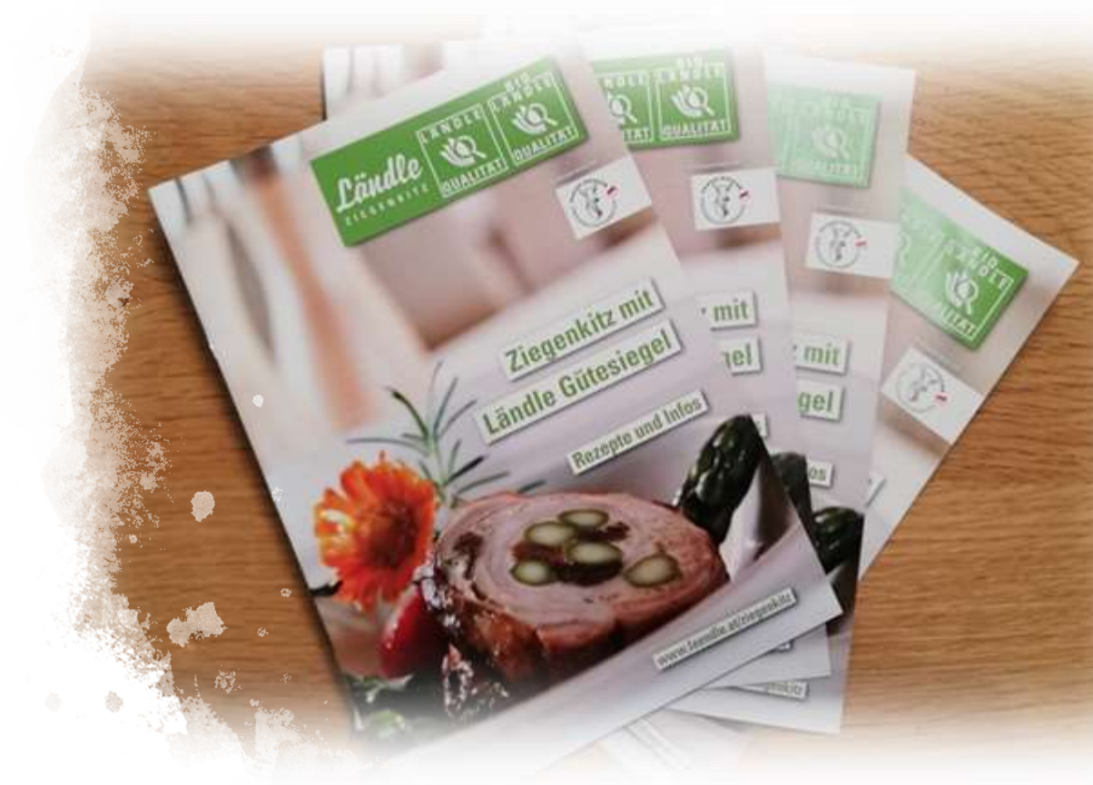
Rezepthefte, Etiketten für die Direktvermarktung,...