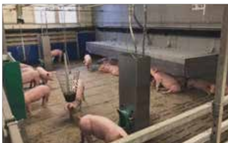
Abb.1: Skizze eines Versuchsabteiles (links); Fotos der beiden Buchtendesigns (rechts)