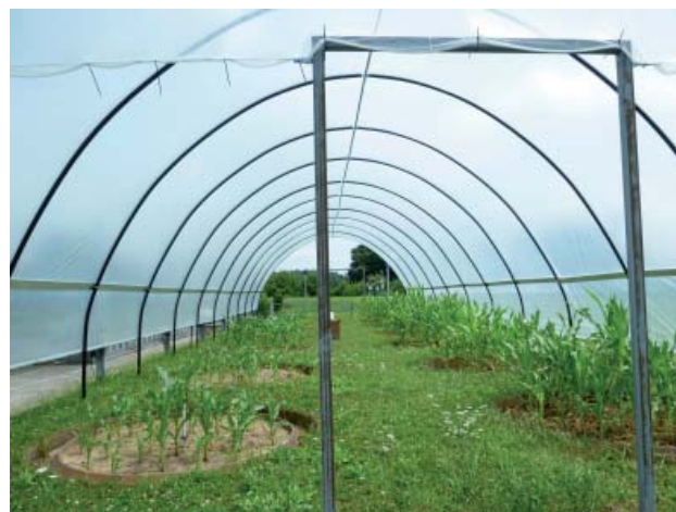
Abbildung 1: Überdachte Lysimeteranlage

Jede der drei Kulturperioden widmet sich einer landwirtschaftlichen Kultur, beginnend mit Silomais, wobei jeweils drei Verfahren à zwei Wiederholungen parallel auf beiden Böden getestet werden.