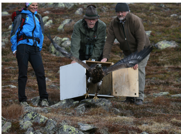
Abbildung 1: Der an einer Bleivergiftung erkrankte Steinadler „Opa“ konnte nach monatelanger Pflege wieder in die Freiheit entlassen werden

Im Mai 2013 kam es zum Koalitionsabkommen zwischen der ÖVP und den Grünen. Inhalt dieses Koalitionsabkommens war unter anderem der Schutz der großen Beutegreifer, was das politisch sensible Thema „bleifreie Munition“ integrierte.