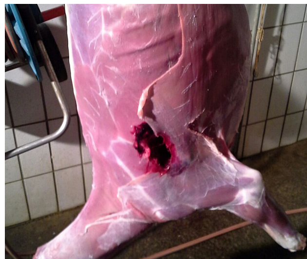
Abbildung 3: Die Auswirkungen auf den Zustand des Wildbrets waren insbesondere bei Deformations- gegenüber Splittergeschossen deutlich zu erkennen

Der Tiroler Jägerverband reagierte umgehend auf die sich überschlagende Ereignis und erhob zunächst mittels eines Fragebogens Erfahrungen mit bleifreier Büchsenmunition innerhalb der Tiroler Jägerschaft. Daraus ging u.a. hervor, dass erst 5,07% der befragten Jäger auf bleifreie Büchsenmunition umgestellt hatten. Demgegenüber aber 73,6% bereit wären, die Umstellung durchzuführen. Die Jägerschaft war somit bereits 2013 größtenteils zum Umstieg auf bleifreie Büchsenmunition positiv eingestellt. Dies selbstverständlich unter der Voraussetzung der entsprechenden Präzision und tierschutzgerechten Tötungswirkung.