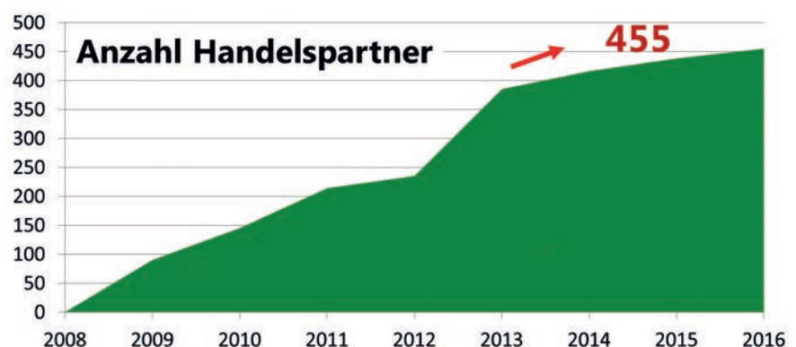
Abb. 3: Anzahl Handelspartner 2008-2016.

Neben einer kindgerechten Aufmachung wurde die Gestaltung der Verpackung oder die Formung des Lebensmittels auf