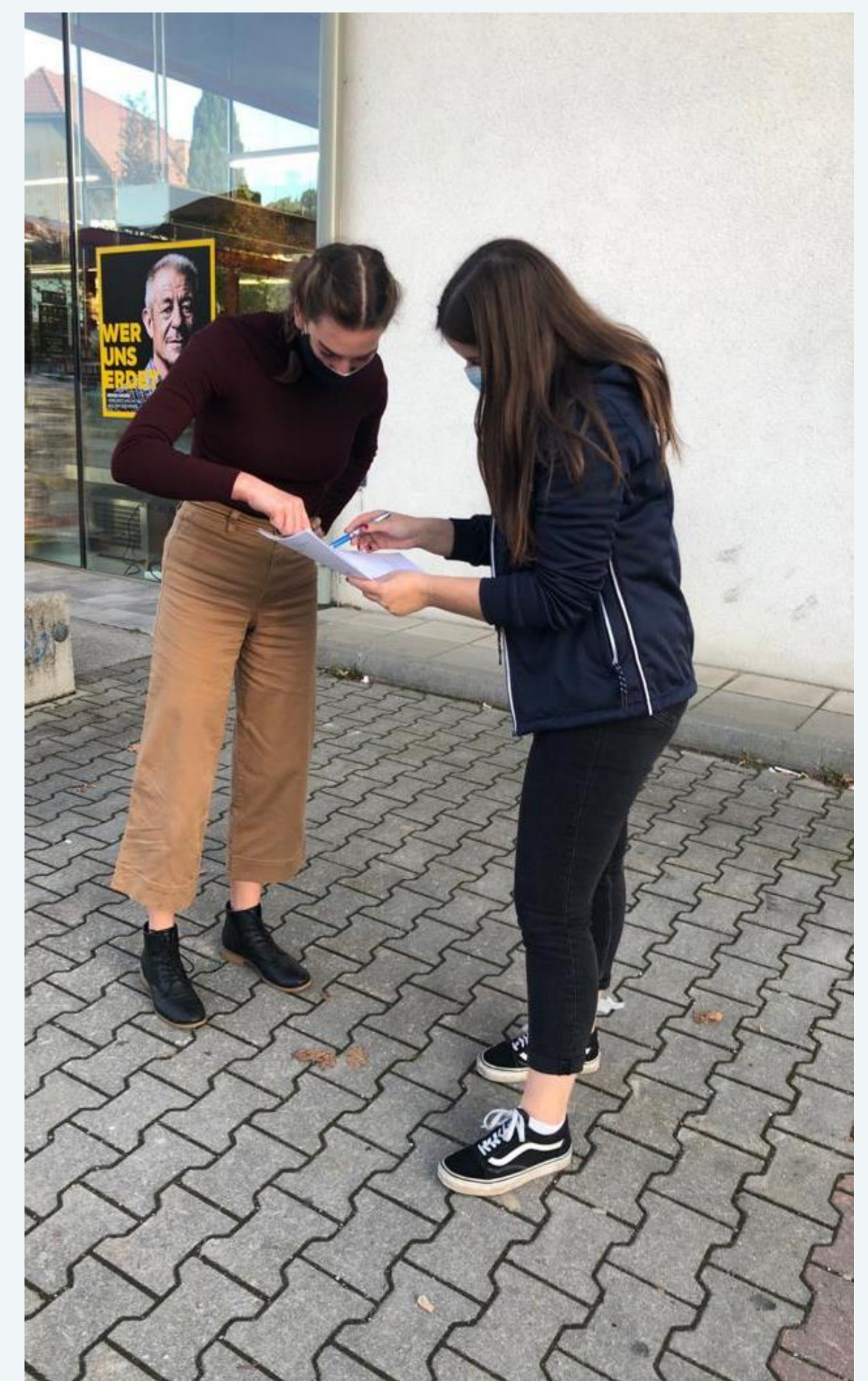
Abb. 3: Durchführung der Befragung Hartberg (Quelle: EIBISBERGER, 2020).