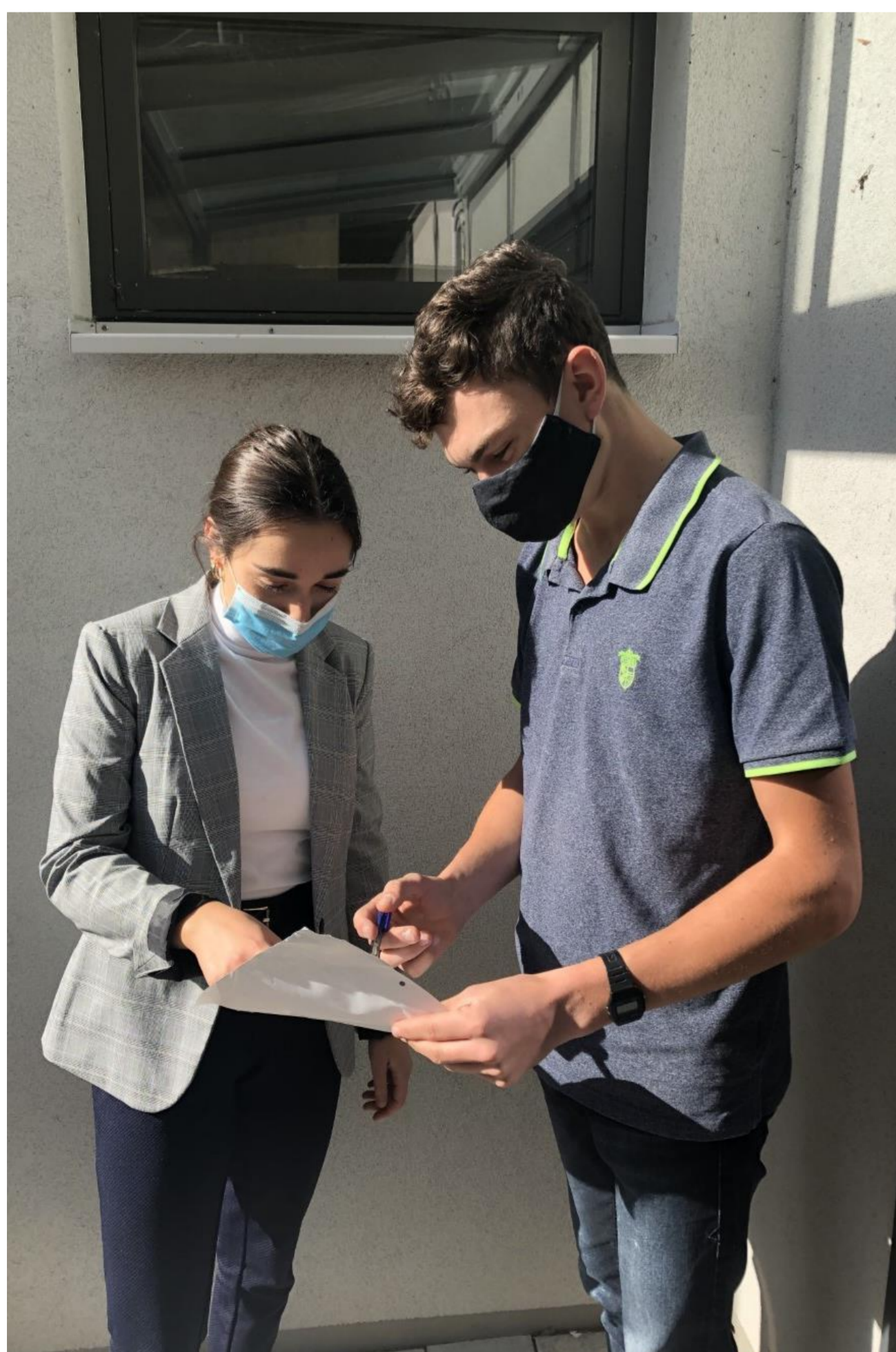
Abb. 1: Durchführung der Befragung Murau (Quelle: KANDLHOFER, 2020).