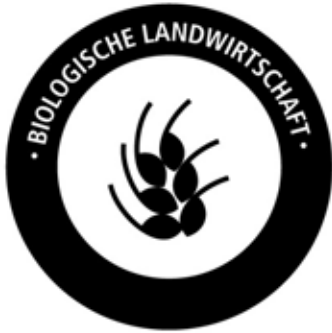
PANTONE REFLEX BLUE