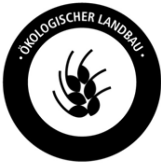
PANTONE REFLEX BLUE