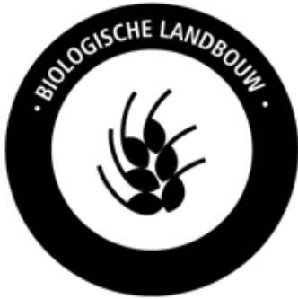
PANTONE REFLEX BLUE