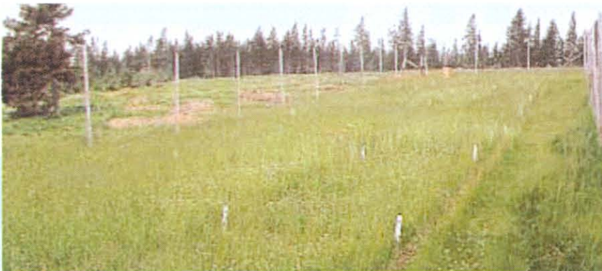
▲ Gut gelungene Einsaat am Versuchstandort Eschwaldalm.