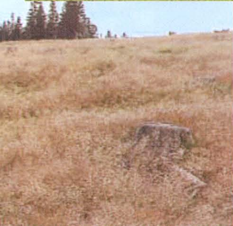
◀ Abgestockte Flächen müssen innerhalb weniger Monate begrünt werden, um das Aufkommen unerwünschter Vegetation zu verhindern.

pH-Wert, Humusgehalt und Gehalt an Hauptnährstoffen erhoben und bei der Planung der Düngemaßnahmen sowie bei der Auswahl der Saatgutmischung miteinbezogen werden. Falls eine Grundversorgung von Hauptnährstoffen nicht gewährleistet ist, sollte zumindest eine Düngung mit Phosphor und Kalium durchgeführt werden, auf sauren Böden kann sich ohne Kalkung keine qualitativ oder quantitativ hochwertige Vegetation entwickeln. Eine Startdüngung mit organischem Langzeitdünger bzw. Wirtschaftsdünger ist zu empfehlen, da diese die Nährstoffe langsam über mehrere Wochen an die heranwachsende Vegetation abgeben können. Aufgrund der kürzeren Vegetationszeit und der geringen Bodenaktivität sind bei extensiver Nutzung solcher Flächen Düngermengen um 80–120 kg K 2 O bzw. P 2 O 5 (korrespondierend mit den Ergebnissen einer empfohlenen Bodenuntersuchung) sowie maximal 60–80 kg N zur Anlage ausreichend.