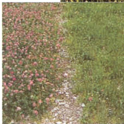
Vergleich einer herkömmlichen (links) mit einer standortgerechten (rechts) Saatgutmischung auf 1850 m Seehöhe.

Heumulchsaat zurückzugreifen. Gerade in Hochlagen ist manchmal noch brauchbares Material von Heustadeln oder Bergmähdern zu gewinnen. Wichtig ist, auf exponierten und steileren Flächen mit Erosionsgefährdung unbedingt eine Mulchsaat mit ausreichender Abdeckung des Oberbodens mit Heu oder Stroh auszuführen. Eine ganz gute, sehr sichere Methode in Hochlagen ist die Schlafsaat, welche in der Praxis beste Ergebnisse bringt und auch auf Almflächen mit Erfolg eingesetzt werden kann. Deckfruchtansaat ohne Mulchschicht sind in Hochlagen ungenügend.