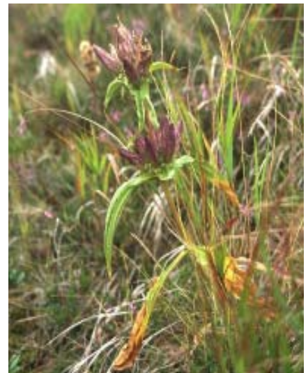
Abbildung 1: Gentiana pannonica (Ungarischer Enzian)

Tiefgründige, steinlose und zwecks leichterer Ernte, siebfähige, möglichst unkrautfreie Böden wählen. Stauende Nässe oder Moorböden sind weniger geeignet. Der pH-Wert des Bodens soll nicht über 6,5 betragen, d.h. es sind nicht unbedingt kalkreiche Standorte zu wäh- len, jedoch kühlere Lagen. In der Frucht- folge nach Hackfrüchten stellen. Die Kultur bleibt vier bis fünf Jahre auf dem