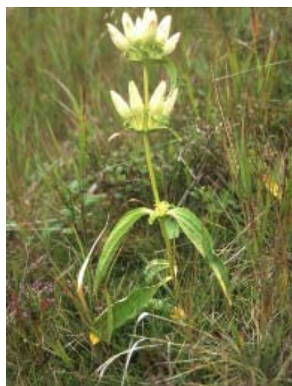
Abbildung 2: Gentiana punctata (Punktierter Enzian)