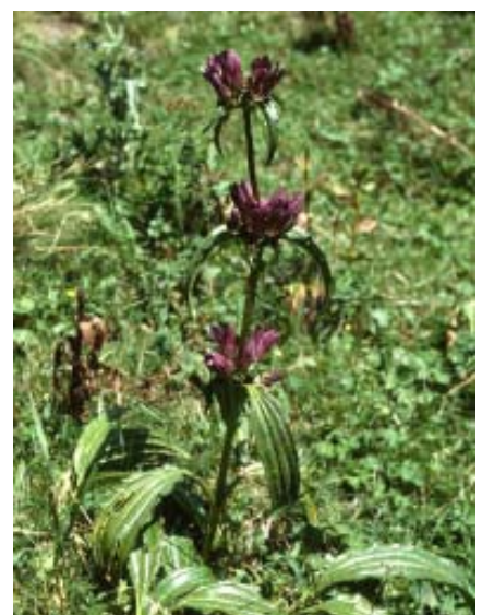
Abbildung 3: Gentiana purpurea (Purpurblütiger Enzian)