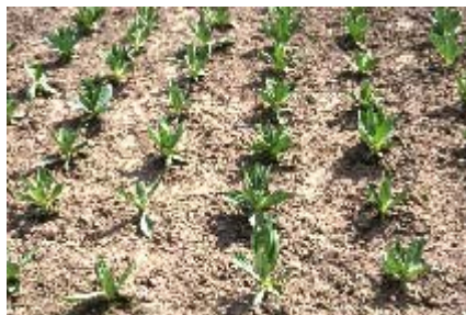
Abbildung 4: Bestand vom Gelben Enzian im zweiten Standjahr