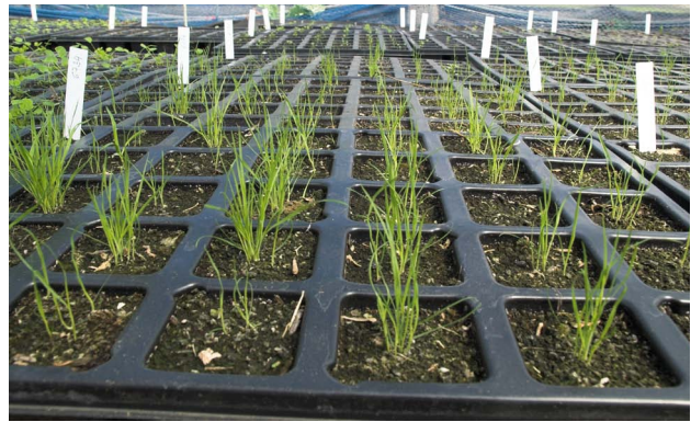
Abbildung 4: Gekeimtes Gras in Horden im Folientunnel

Neben der Sichtung der Akzessionen aus unserem Saatgutlager und der Überführung des Materials in die Genbank werden in Zukunft auch vermehrt Sammlungen in Zusammenarbeit mit Naturschutzabteilungen der Länder durchgeführt werden. Nach der Sichtung des Saatgutes erfolgte die Kontrolle der Keimfähigkeit und gegebenenfalls die Reproduktion mit Aussäen in Pflanzschalen im Folientunnel und das Ansetzen von mindestens 50 Einzelpflanzen. Nach der Ernte der Samen wurden diese getrocknet und nach eingehenden