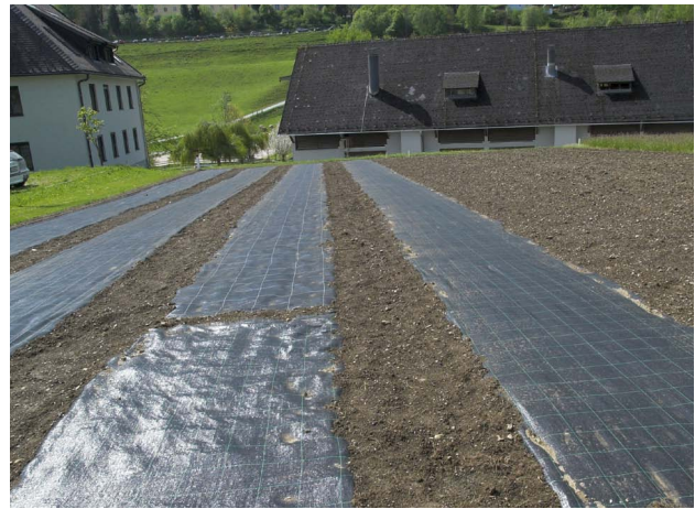
Abbildung 1: Seitlich eingegrabene Pflanzfolien für die Vorbereitung der Einzelpflanzenanlagen

Bei einer geringen Keimfähigkeit (unter 70%) wurden die Samen im Folientunnel in Keimschalen mit Blumenerde eingelegt und vorgezogen. Aus den Sammlungen der 90er Jahre kamen ca. 60% der vor-