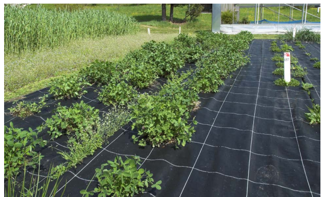
Abbildung 6: Ausgepflanzte Einzelpflanzen auf Pflanzfolie (Rotklee) im Jahr nach der Anlage

Untersuchungen in das Langzeitlager übergeführt, die dazugehörigen Passportdaten erhoben und eingetragen. Zusätzlich sollen in Zukunft Fotos von den einzelnen Akzessionen (Samen) mit einem Tischstativ erstellt werden und zu den Beschreibungen in die Datenbank dazugefügt werden. Eine zukünftige Aufgabe sollte auch die Erfassung der Aufwuchscharakteristika in Form von digitalisierten Fotos sein, dabei ist aber der Habitus der Pflanzen in Einzelpflanzenanlagen im Reinbestand zu berücksichtigen.