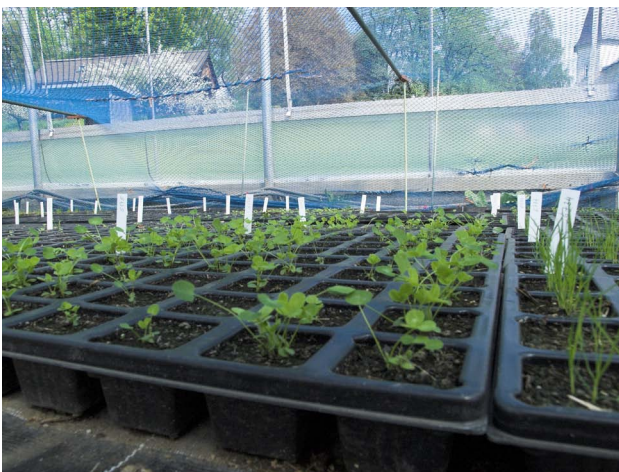
Abbildung 3: Gekeimte Leguminosae in Horden im Folientunnel

Die Trocknung und das Einfrieren wurde systematisch und kontinuierlich durchgeführt. Für die Trocknung der Saatgutproben wurde ein Trockenschrank aus Plexiglas verwendet (Rotilabo 410 x 305 x 175 mm), der einen doppelten Boden aufweist. Die Lade im Zwischenboden wird mit Silikagel gefüllt und damit wird dem Saatgut über 3 bis 4 Wochen Feuchtigkeit entzogen bis ein Wert von ca. 5% Restfeuchte erreicht wird. Zum Einsatz kommt ein Silikagel auf Eisenbasis mit kleinen orangen Kugeln (2-5 mm Durchmesser), die keine giftigen Stoffe absondern und bei Feuchtigkeitsannahme durchsichtig werden.