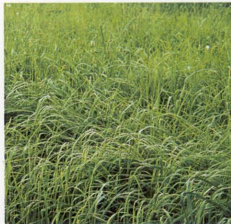
Tandem ist weich im Blatt und wird von den Tieren gerne aufgenommen.

Die Züchtung von Tandem hat etwa zehn Jahre gedauert. Tandem wurde 1995 in die Beschreibende Sortenliste in Österreich und in den Europäischen Sortenkatalog eingetragen. Nach siebenjähriger Prüfung wurde sie auch in die ÖAG-Sortenliste aufgenommen.