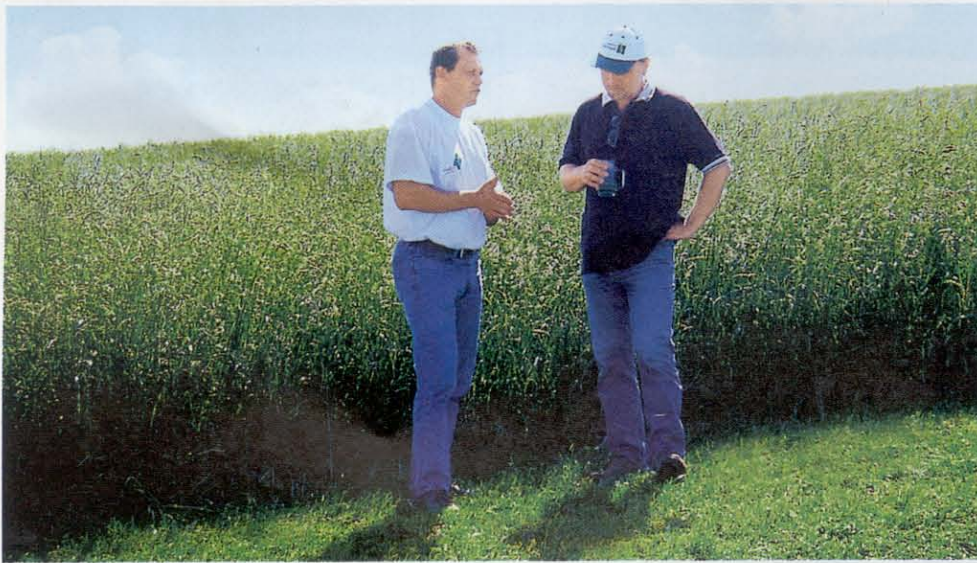
100 t Reinware von Tandem werden auf rund 200 ha Vermehrung in Österreich in höchster Qualität für die ÖAG-Mischungen produziert.

Bevor die Sorten von Gräsern und Kleearten in den Handel gelangen, müssen sie vorher in der offiziellen Sortenwertprüfung drei Jahre von der AGES und der HBLFA Raumberg-Gumpenstein geprüft werden. Um den strengen und rauen Bedingungen auf unseren Wiesen, Weiden und Feldfutterflächen Rechnung zu tragen, wird eine besondere Ausdauerprüfung über fünf bis sieben Jahre durchgeführt. Bei der Knaulgrassorte Tandem, einer Züchtung der HBLFA Raumberg-Gumpenstein, liegen nun 11-jährige vergleichende Exaktversuche mit den besten Knaulgrassorten der Welt vor. Mittlerweile konnten einheimische Landwirte Tandem in hoher Qualität und ausreichender Menge vermehren, so dass der Grünlandbauer diesen Fortschritt in seinen Saatgutmischungen nicht nur am Feld, sondern bis hin zur Fütterung erkennen kann.