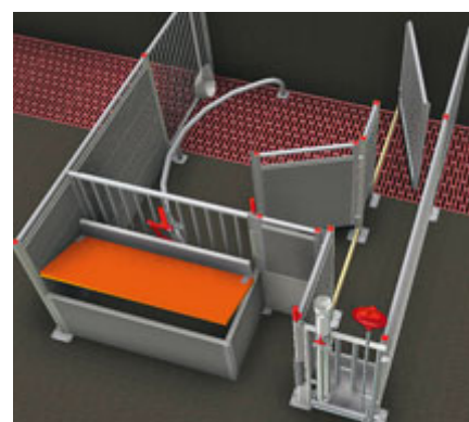
Die WelCon-Abferkelbucht von Schauer.

Abferkelbucht“ ist die von der Stallbau-firma Schauer Agrotronic vertriebene „WelCon Abferkelbucht“. Die Stallvariante der WelCon-Bio ermöglicht in der kalten Jahreszeit eine bessere Temperatursteuerung als im Außenklimastall. Wesentlich bei dieser Variante ist, dass das Konzept sowohl als Biobucht (Auslauf, planbefestigter Boden), als auch als konventionelle Bucht (ohne Auslauf, Perforation) umgesetzt werden kann.