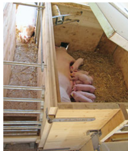
Liegebereich getrennt vom Fressstand.

Die Anzahl der lebend geborenen Ferkel variierte zwischen 4 und 21, mit dem Mittelwert von 12,48. Bei 11,5 % der Sauen musste manuelle Geburtshilfe geleistet werden, bei 17,7 % der Sauen wurde Oxytocin verabreicht. Von den 12,48 lebend geborenen Ferkeln wurden