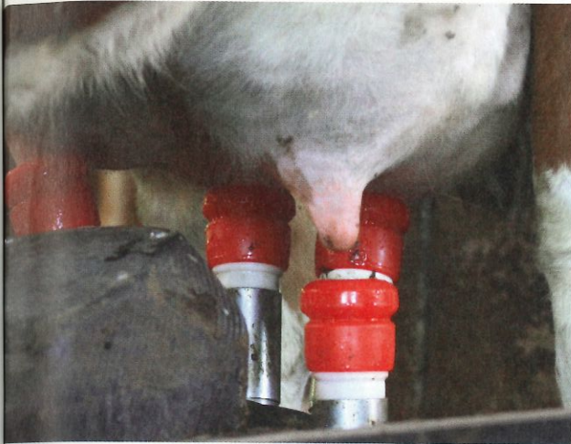
Mit der richtigen Einstellung der Melkberechtigung kann am Melkroboterbetrieb Rohmilch für die Hartkäseproduktion erzeugt werden.

Fütterung und Eutergesundheit beeinflussen die Milchqualität. Auch das Lagern und Verarbeiten spielt eine Rolle. Schweizer Untersuchungen zeigen, dass die Käsetauglichkeit auch von den Zwischenmelkzeiten abhängt.